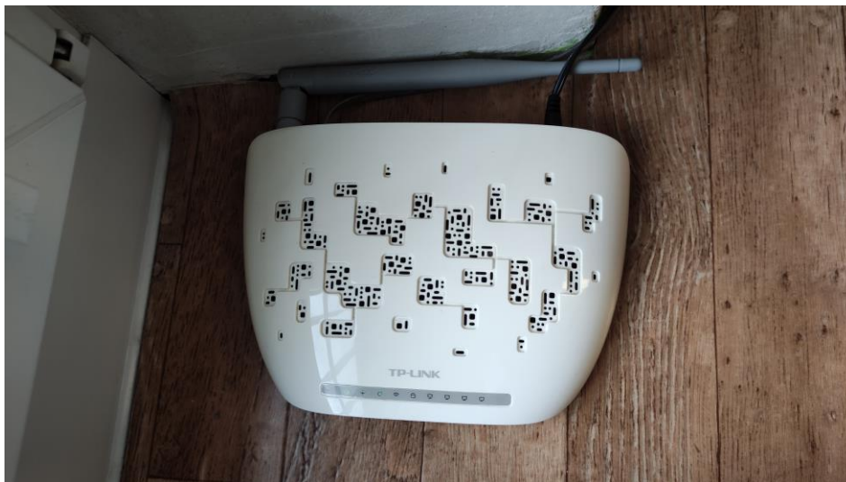
Fot. 1: Widok punktu dostępowego model TD-W8951ND