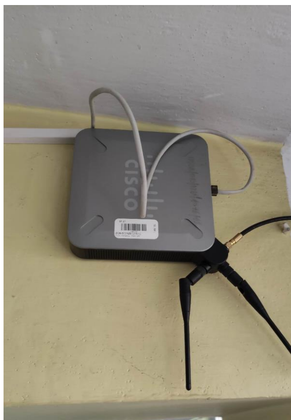
Fot. 2: Widok punktu dostępowego model WAP4410N