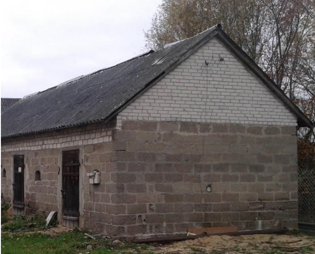
zdjęcie z perspektywy całego budynku