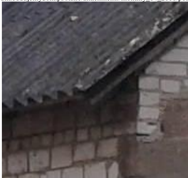
zdjęcie detalu ukazujące część eternitu na dachu