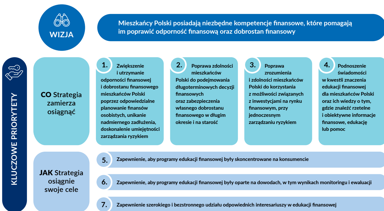
Wykres 1. Wizja i kluczowe priorytety KSEF

Siedem priorytetów kluczowych opisanych w tym rozdziale zostało wybranych na podstawie analizy i danych opisanych w raporcie „Znajomość zagadnień finansowych w Polsce: Znaczenie, dowody i oferta edukacyjna” (OECD, 2022[3]), dyskusji pomiędzy członkami krajowej grupy roboczej oraz konsultacji z szerokim gronem interesariuszy aktywnych na polu edukacji finansowej. Mają one również charakter strategiczny, w zakresie w jakim wspierają kluczowe polityki krajowe opisane w części I. Poniżej przedstawiono uzasadnienie dla każdego priorytetu. Szczegóły ich wdrażania poprzez poszczególne działania zostały przedstawione w części III.