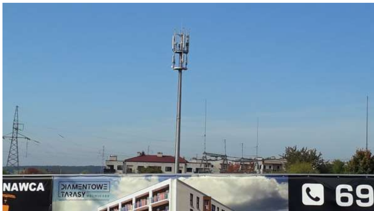
Fot. 1: Widoki anten stacji bazowej ID: BT12816, zlokalizowanej: ul. Diamentowa, dz. nr 50/2, 20-447 Lublin