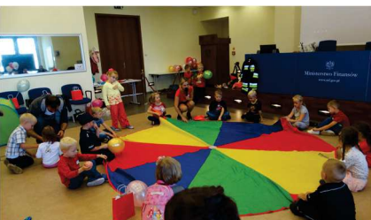
Dzieci w ministerstwie