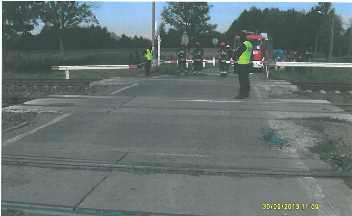
Widok nawierzchni przejazdu .