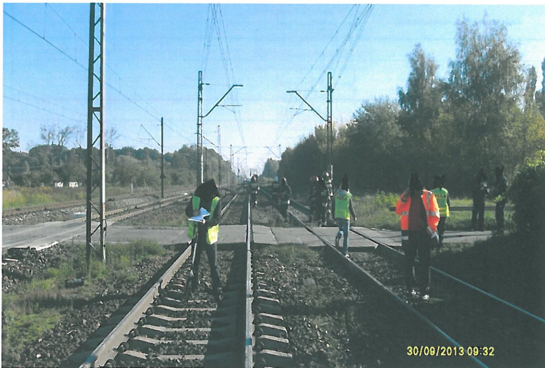
Widok nawierzchni przejazdu – widok z boku.