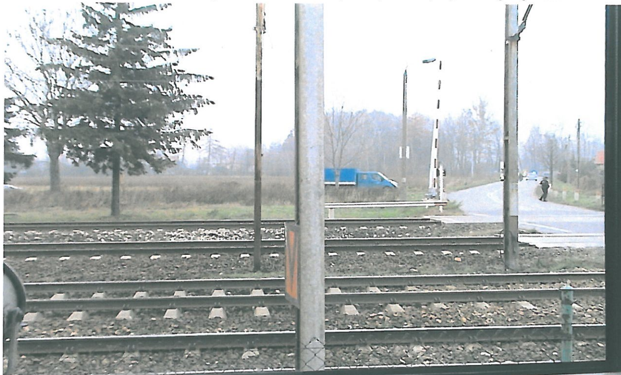
Widok ze stanowiska dróżnika przejazdowego z posterunku nr 1 „POM”