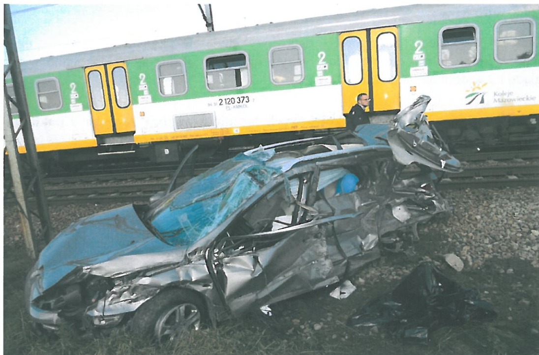
Widok samochodu marki Peugeot 407 po wypadku

Samochód osobowy Peugeot 407 uczestniczący w wypadku – uszkodzenia stwierdzone w obrębie podstawowych układów mających wpływ na bezpieczeństwo jazdy samochodu powstały na skutek działania zewnętrznych sił doraźnych w trakcie wypadku. Nie ma podstaw do przyjęcia, że w/w pojazd mógł być niesprawny przed wypadkiem.