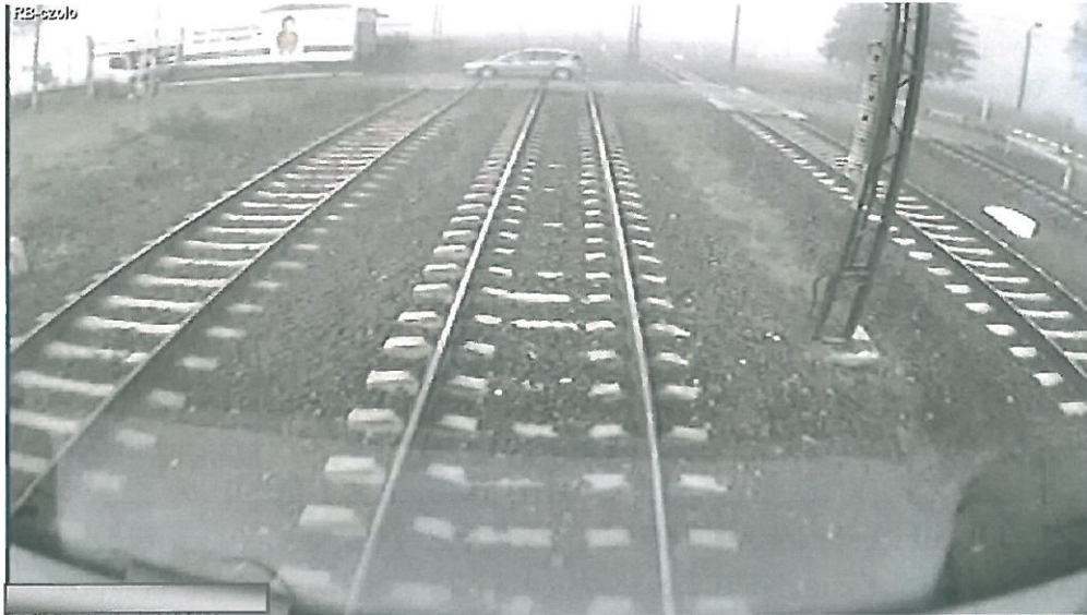
Widok z kamery zamontowanej w kabinie pociągu KM nr 90221 znajdującego się ok. 70 metrów od przejazdu.

S.A. - Zakład Centralny, uderzając w jego tylną część bagażową. Spowodowało to częściowe obrócenie i przemieszczenie samochodu osobowego poza skrajnię toru nr 2. Czoło pociągu nr MPE 91502 zatrzymało się w km 32.435, tj. w odległości 520 m za przejazdem i 566 m od miejsca uderzonego samochodu. Samochodem osobowym marki Peugeot 407 kierowała kobieta lat 36 przewożąca dwoje dzieci w wieku 1,5 i 9 lat.