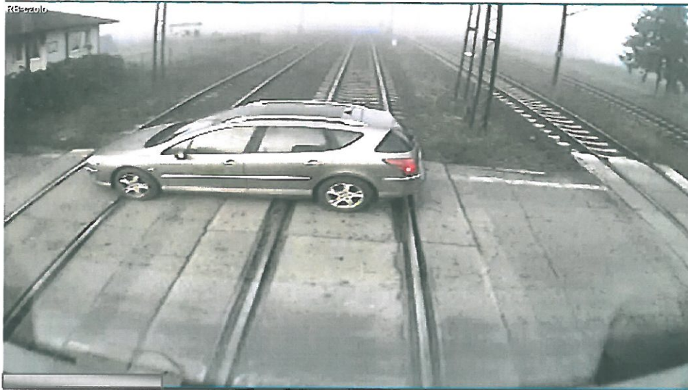
Widok z kamery zamontowanej w kabinie pociągu KM nr 90221 wjeżdżającego naprzeciw.