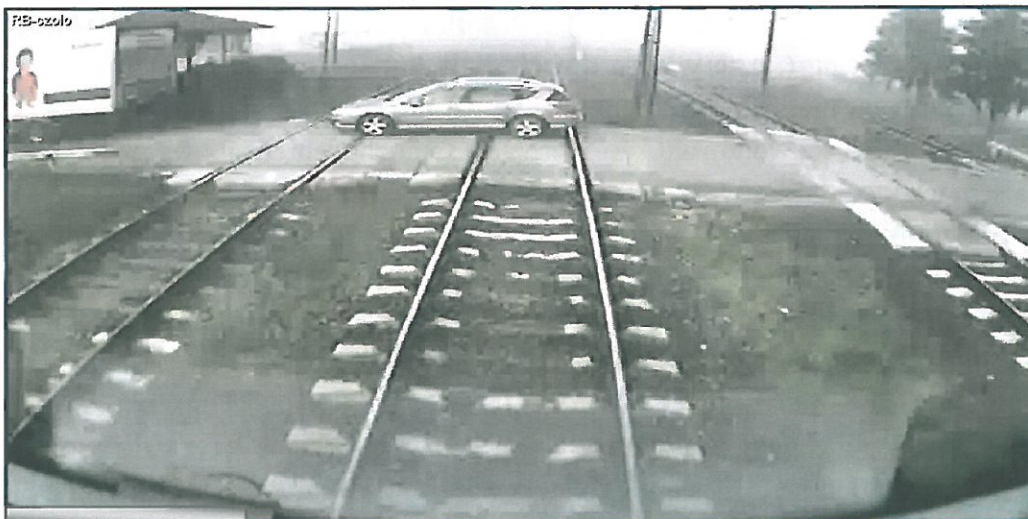
Widok z kamery zamontowanej w kabinie pociągu KM nr 90221 znajdującego się ok. 15 metrów od przejazdu.