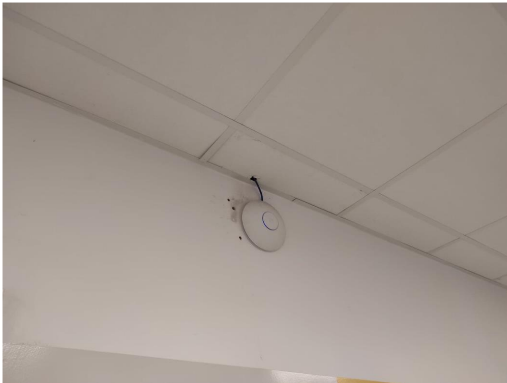
Fot. 1: Punkt dostępowy model UAP-AC-PRO