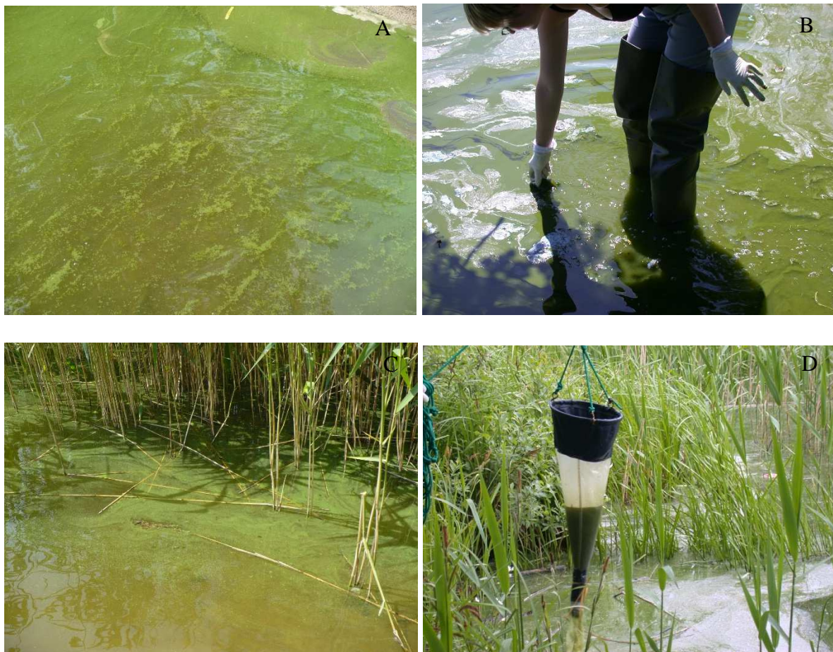
Zdj.2. Masowe zakwity sinic w jeziorach kaszubskich

Pojęcie „zakwity wody” jest stosowane do opisanego dużego zagęszczenia drobnych komórek glonów lub sinic, które występują przy powierzchni wody, co często jest sygnalizowane zmianą barwy wody a na powierzchni wody można wyraźnie zaobserwować gęste smugi wyglądające jak rozlana farba, a nawet grube kożuchy piany o galaretowatej konsystencji. Smugi pojawiają się najczęściej w strefie brzegowej, gdy słaby wiatr spycha je do brzegu, mają przeważnie kolor zielony (w różnych odcieniach, Zdj. 2 A-D), żółto-brązowy (Zdj. 3 A-B), czerwony a nawet pomarańczowy, różowy czy niebieski. Zakwity wody mogą być spowodowane masowym występowaniem jednego, dwóch lub wielu gatunków mikroorganizmów – zazwyczaj są to sinice, jednak w sprzyjających warunkach mogą to być również zieleńce, złotowiciowce, kryptofity lub bruzdnice i okrzemki (zwłaszcza w morzach i oceanach).