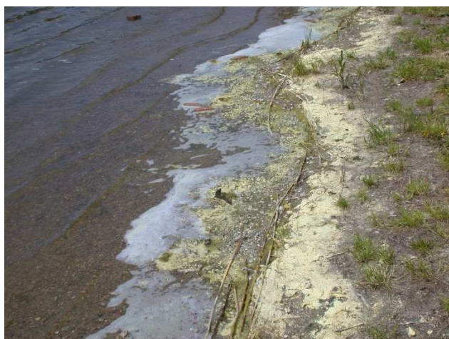
Zdj. 4. Pyłki sosny na brzegu jeziora Tuchomskiego

Wrażenie „zakwitów wody” mogą dawać też duże ilości pyłków drzew – zwłaszcza sosny, które wiosną mogą być przenoszone przez wiatr nawet na duże odległości i opadać na powierzchnię wody. Przez wiatr i falowanie wody pyłek może być przenoszony w przybrzeżną strefę jeziora, powodując wyraźne żółte zabarwienie wody (Zdj. 4). Podobne zjawisko można obserwować również wiosną u wybrzeży Bałtyku.