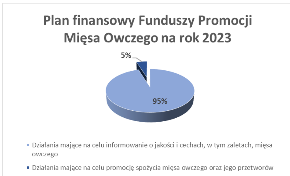
Wykres nr 3. Struktura Planu finansowego FPMO na rok 2023

W Planie finansowym FPMO na rok 2023 na zadania zgodne z celami funduszu promocji mięsa owczego przeznaczono kwotę 36 272,61 PLN .