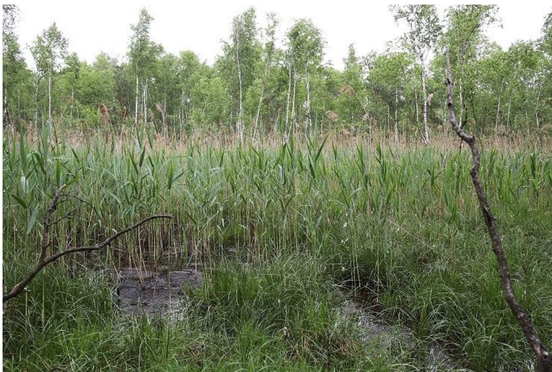
Fot. 1. Widok ogólny na trzcinę w rezerwacie przyrody „Prądy” (teren bagienny, silnie podmokły).