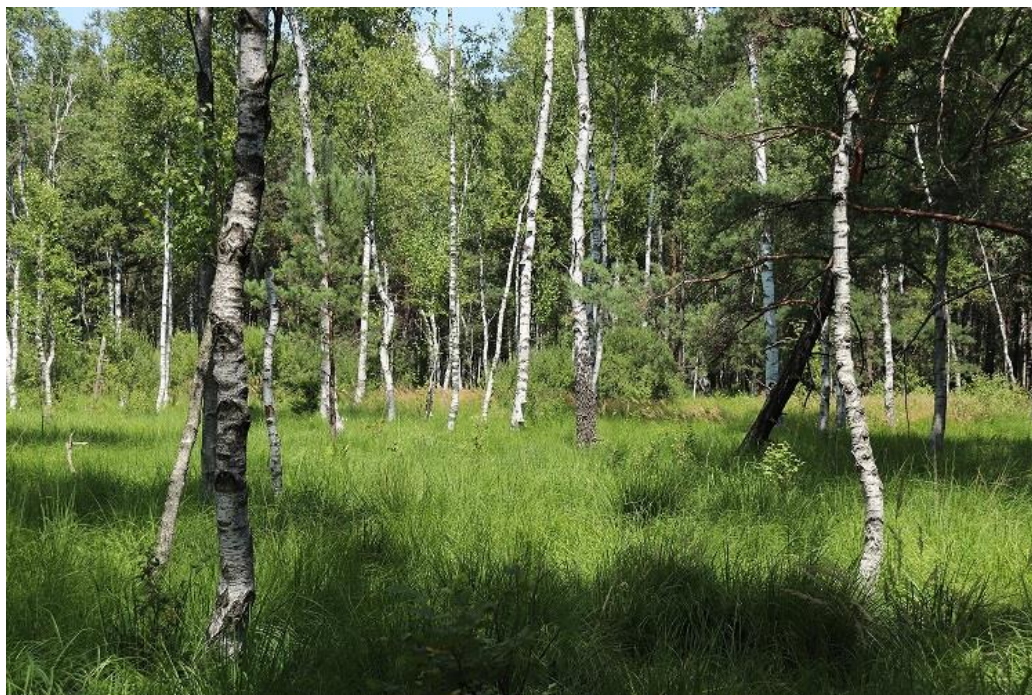
Fot. 2. Widok ogólny w rezerwacie przyrody „Złote Bagna” (teren bagienny, silnie podmokły).

Miejsca prowadzenia zabiegów wraz z załącznikiem graficznym (tj. lokalizacja płatów tawuły kutnerowatej i trzciny pospolitej objętych zamówieniem, miejsca pozostawienia (składowania) biomasy w terenie) zostaną wskazane przez nadzór przyrodniczy, a materiały graficzne wraz z warstwami informacji przestrzennej o rozmieszczeniu płatów (format .kml lub .shp) zostaną przekazane Wykonawcy przez Zamawiającego po podpisaniu umowy, w uzgodnionym wcześniej terminie. Wskazanie wraz z przekazaniem odbędzie się w godzinach pracy Zamawiającego (pn.-pt. w godz. 7.30 – 15.30).