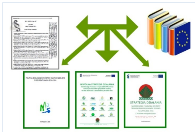
Rys. 4 Podstawy funkcjonowania NFOŚiGW i WFOŚiGW

Unijnym priorytetem do roku 2020 – ze względu na zagrożenia wynikające ze zmian klimatu – będzie przejście na niskoemisyjną gospodarkę i efektywne korzystanie z zasobów. W nowej perspektywie finansowej 2014–2020 najwięcej środków Komisja Europejska przeznaczy na wsparcie efektywności energetycznej i odnawialnych źródeł energii, na badania i działania innowacyjne, na wsparcie małych i średnich przedsiębiorstw, a także na rozwój obszarów wiejskich.