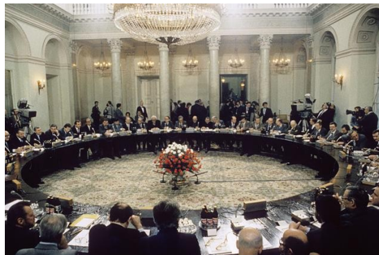
Fot. 1 Sala obrad „Okrągłego Stołu” w 1989 r.

W wyniku obrad „Okrągłego Stołu” i transformacji ustrojowej Polski, w 1989 roku utworzony został system opłat i kar za korzystanie ze środowiska , a środki z tego źródła przeznaczone zostały w całości na przedsięwzięcia proekologiczne. Zarządzanie tymi środkami powierzono Narodowemu Funduszowi oraz wojewódzkim funduszom ochrony środowiska i gospodarki wodnej. W ten sposób utworzono system funduszy ekologicznych , który jest znakomitą dźwignią rzeczywistego i szybkiego postępu w ochronie środowiska w Polsce. W burzliwych czasach transformacji ustrojowej był to dowód nowoczesnego myślenia o sprawach ochrony środowiska uznającego konieczność racjonalnego wykorzystania bogactw naturalnych i ochrony środowiska przyrodniczego jako ponadpokoleniowych wartości.