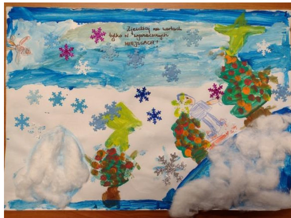
chłopiec z Przedszkola Publicznego w Przecławiu