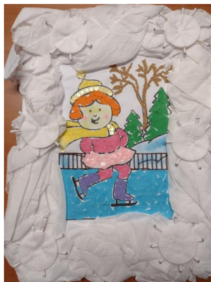
dziewczynka z Przedszkola Publicznego w Kołbaskowie