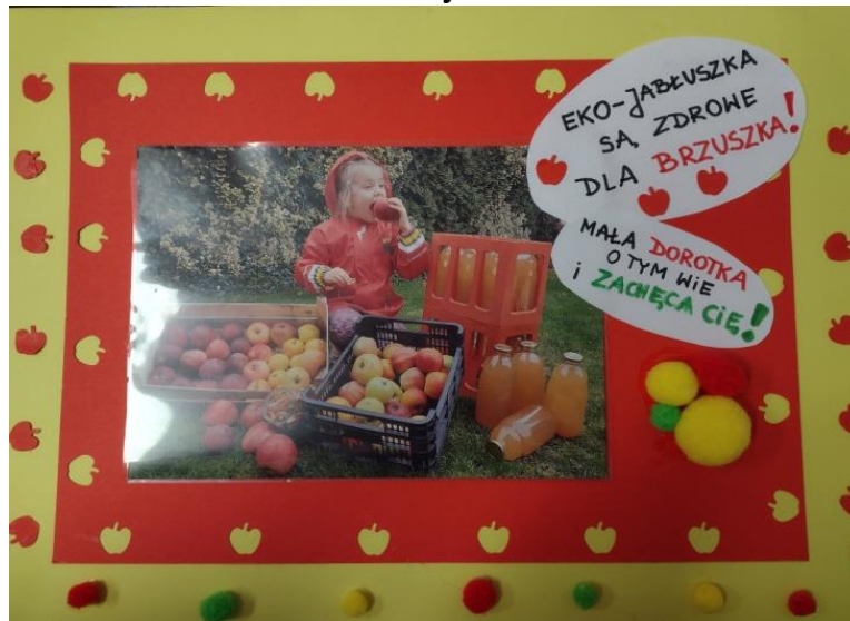
dziewczynka z Przedszkola Publicznego w Przecławiu