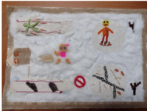
chłopiec z Niepublicznego Przedszkola „Mierzynkowo” w Mierzynie