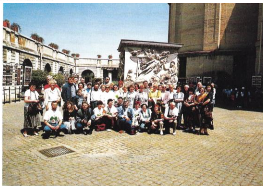
Laureaci konkursu „Rzuć palenie razem z nami” w Włoczek (kwiecień – maj 1997)

Głównym celem działającej przy Centrum Onkologii-Instytucie w Warszawie Fundacji „Promocja Zdrowia” jest zwalczanie nowotworów złośliwych. Fundacja przeniosła na polski grunt prowadzone od lat w USA i krajach Europy Zachodniej, skuteczne działania dla stworzenia mody na niepalenie. Akcja zainicjowana w Polsce w 1991 roku pod hasłem „Rzuć palenie razem z nami” już przynosi korzyści zdrowotne.