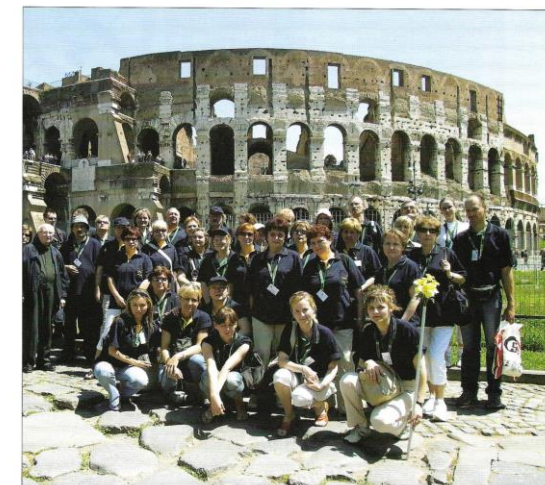
Laureaci konkursu „Rzuć palenie razem z nami”, Rzym

Akcja, dzięki której ponad 3,5 miliona Polaków rzuciło palenie!