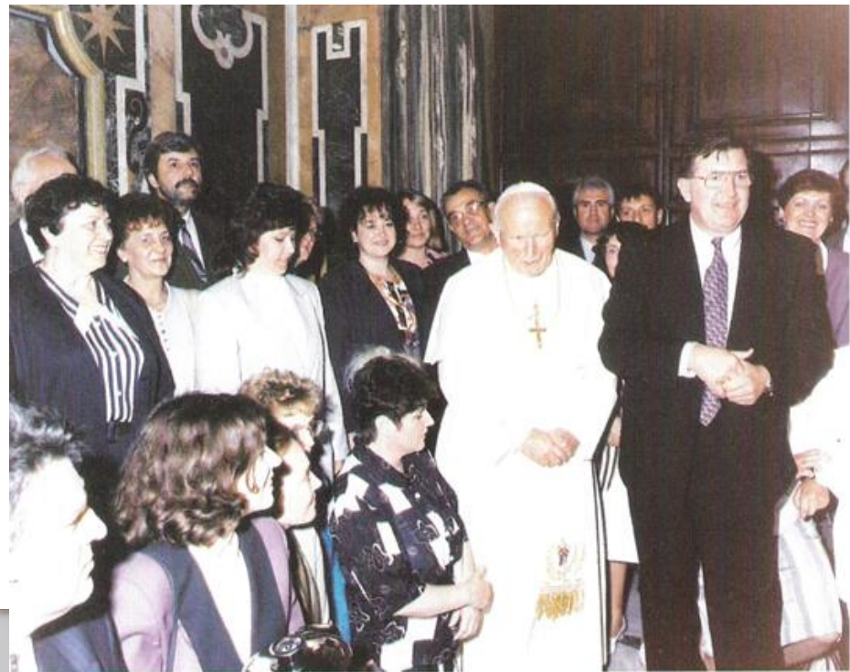
Papież Jan Paweł II wśród laureatów konkursu-akcji „Rzuć palenie razem z nami '95” (Watykan, kwiecień 1996)