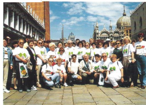
Laureaci konkursu „Rzuć palenie razem z nami” w Włoczek (kwiecień – maj 1996)

„Rzuć palenie razem z nami '96” wrzesień – grudzień 1996 roku