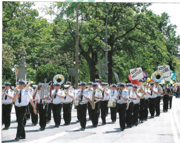
Orkiestra Reprezentacyjna Komendy Stołecznej Policji podczas akcji z okazji Światowego Dnia bez Tytoniu, Warszawa ( 31 maja)