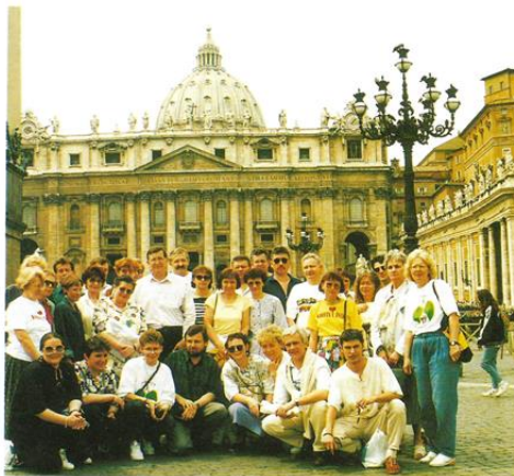
Laureaci konkursu „Rzuć palenie razem z nami” w Rzymie (maj 1995)

„Rzuć palenie razem z nami '95” wrzesień – grudzień 1995 roku