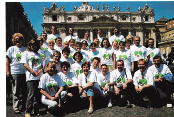
Laureaci konkursu „Rzuć palenie razem z nami” 2001 w Włoczek (kwiecień – maj 2002)