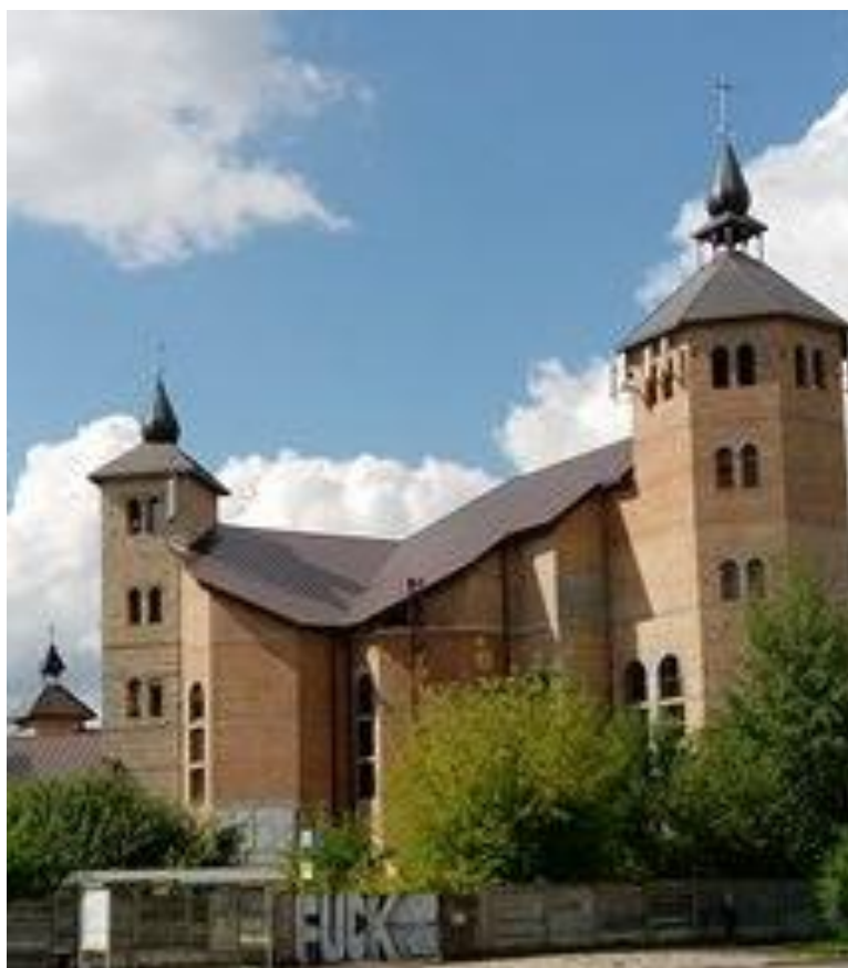
Fot. 1: Widok anten stacji bazowych: ID: BT43917, ID: OLS1028_D, ID: 34026 (44026N!), zlokalizowanych pod adresem: ul. Wilczyńskiego 7, 10-686 Olsztyn