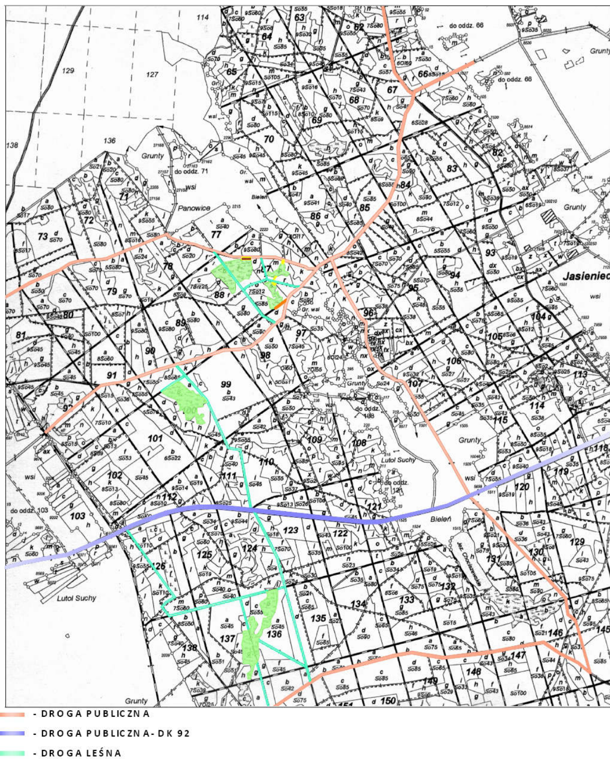
Ryc.2. Dojazd do łąk zlokalizowanych na działkach leśnych z drogi krajowej nr 92.