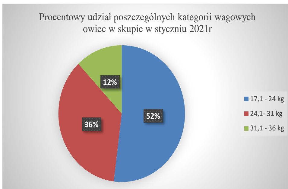
Procentowy udział poszczególnych kategorii wagowych owiec w skupie w styczniu 2021r