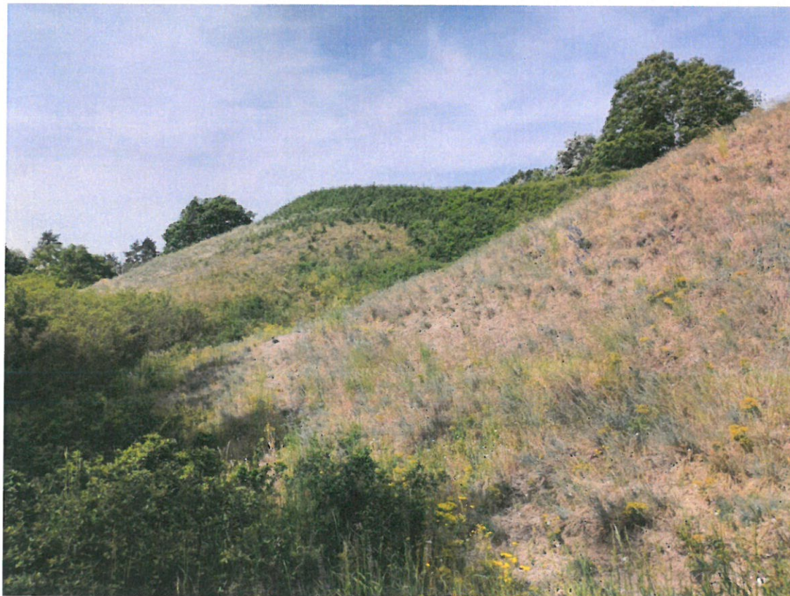
Fot. 2. Zdjęcie poglądowe powierzchni do wycinki