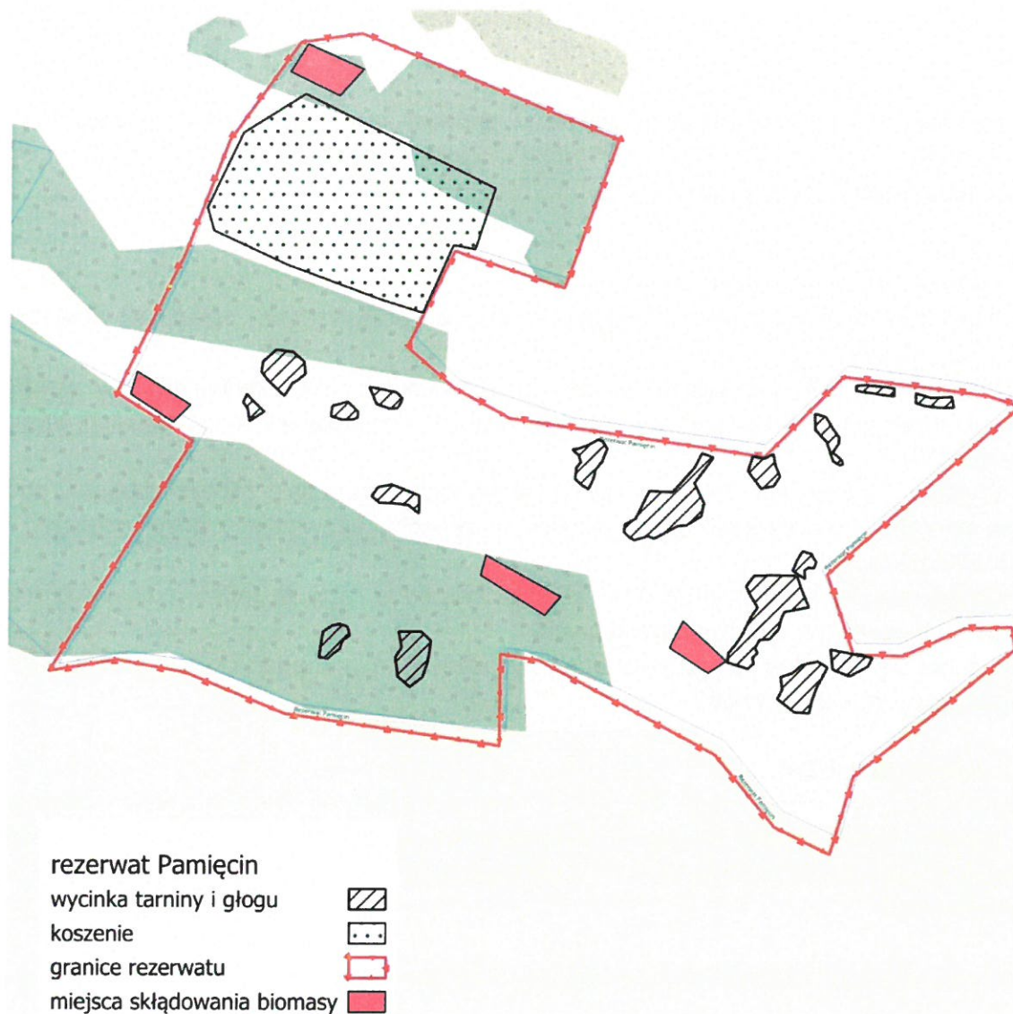
Ryc. 2. Powierzchnia wycinki nalotów drzew i krzewów oraz koszenia łąki w rezerwacie przyrody „Pamięcin”.

5.3 Wyciętą biomasę tarniny, głogów i traw należy złożyć w miejscach oznaczonych na Ryc. 2.