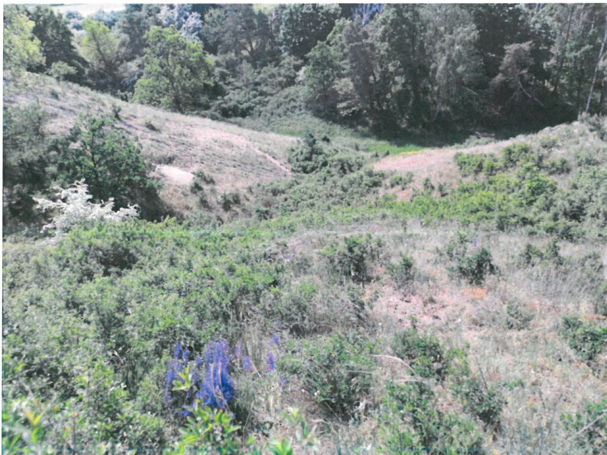
Fot. 3. Zdjęcie pogładowe powierzchni do wycinki