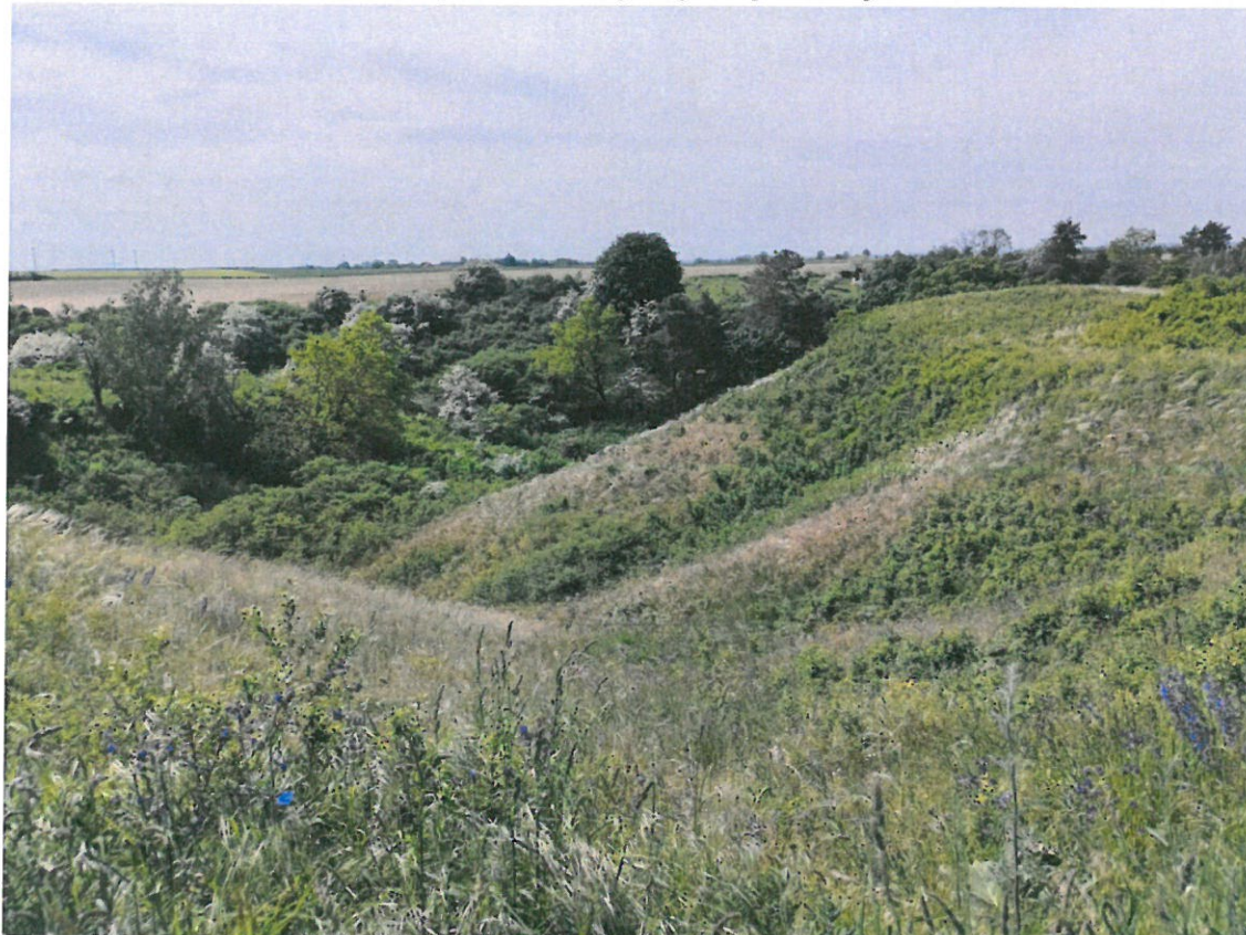
Fot. 1. Zdjęcie poglądowe powierzchni do wycinki

Stan powierzchni wskazanej do ochrony czynnej na maj 2023 r.