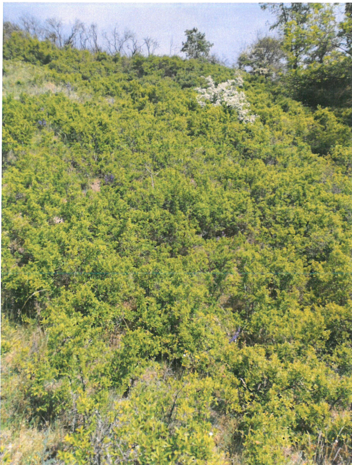
Fot. 4. Zdjęcie poglądowe powierzchni do wycinki

Z up. Regionalnego Dyrektora Ochrony Środowiska w Gorzowie Wielkopolskim