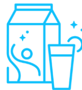
Soki i napoje