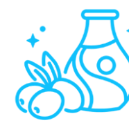
Przyprawy i oleje