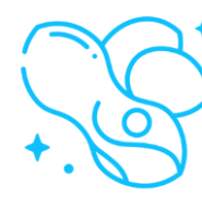
Orzechy, wiórki i owoce suszone