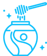
Pasty kanapkowe i muesli