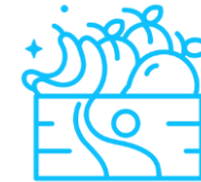
Banany i owoce