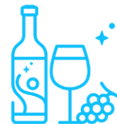
Wina, piwa, alkohole