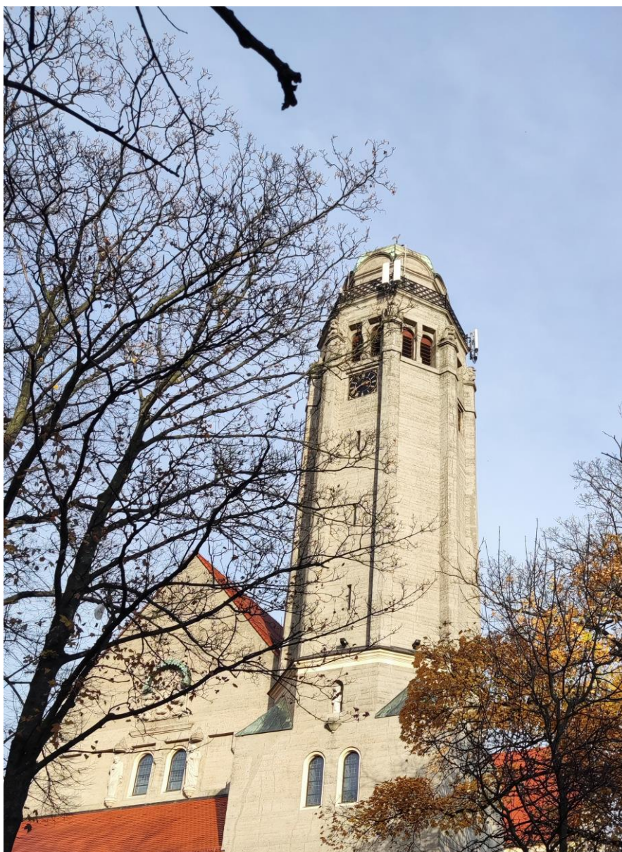
Fot. 1: Widoki anten stacji bazowej: ID: 2595, zlokalizowanej: pl. Mickiewicza 1, Opole