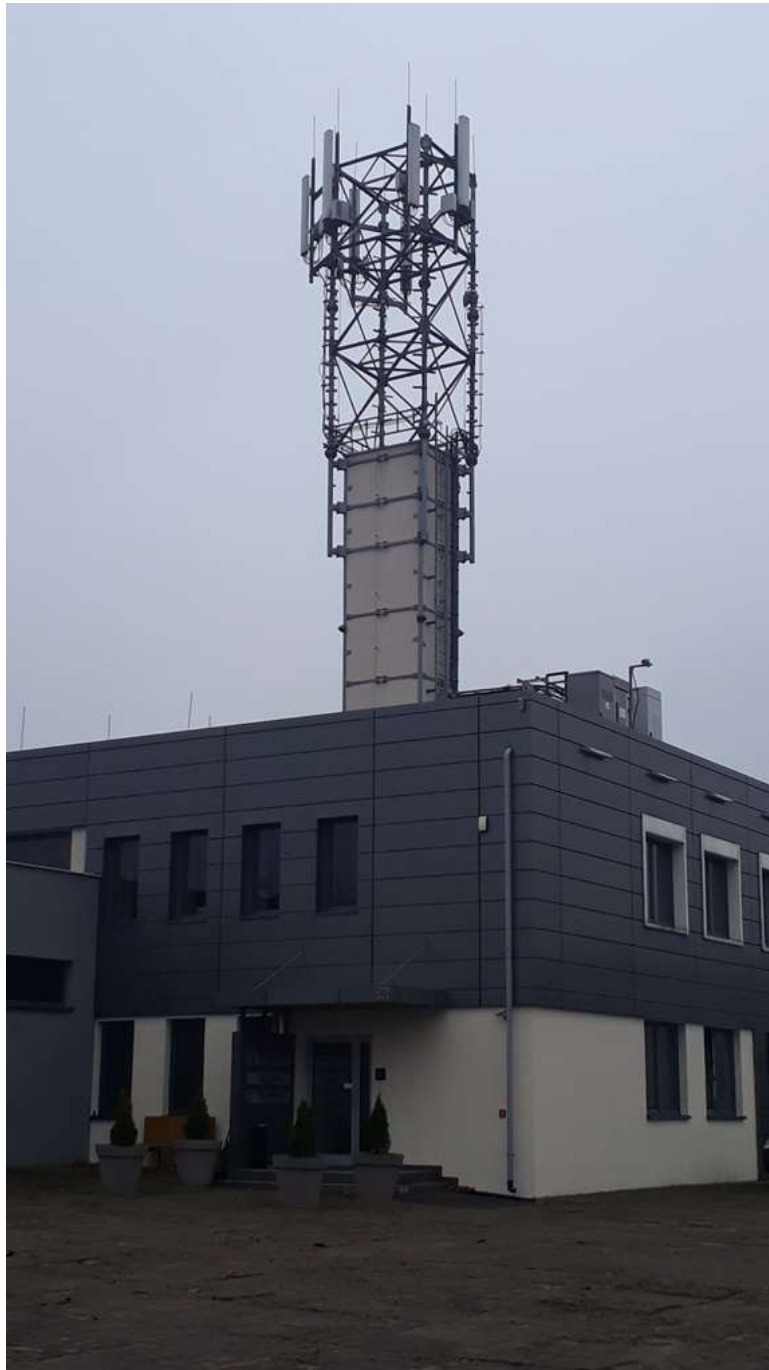
Fot. 1: Widoki anten stacji bazowej ID: BT42516, zlokalizowanej: ul. Nakielska 243a, 85-391 Bydgoszcz