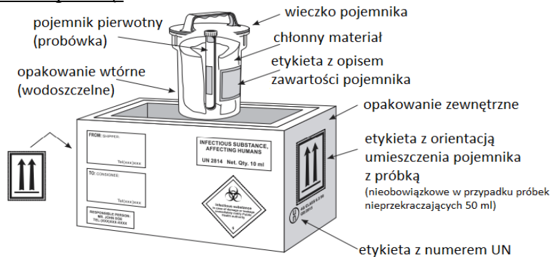
Ryc. 1. Schemat pakowania i etykietowania substancji zakaźnych kategorii A (przesyłanie pojedynczej próbki)

5.2. Wymagania dotyczące zabezpieczenia próbek materiału biologicznego przesyłanych do LBEK za pośrednictwem usług kurierskich oraz próbek zawierających czynniki biologiczne 3 grupy zagrożenia Próbkę zawierającą materiał zakaźny należy zapakować i opisać zgodnie z zasadą potrójnego opakowania (Ryc. 1 i 2). Należy uwzględnić warunki przechowywania i transportu próbek wymagane przez LBEK, (podane w powyższej tabeli). Próbkę należy dokładnie opisać na probówce oraz na etykiecie opakowania wtórnego (sztywnego i szczelnego). Do próbek należy dołączyć papierowe zlecenie i/lub listę z wykazem przesyłanych próbek, które należy umieścić w plastikowej koszulce, w osobnej kopercie – nie dołączać bezpośrednio do pojemnika z próbką.