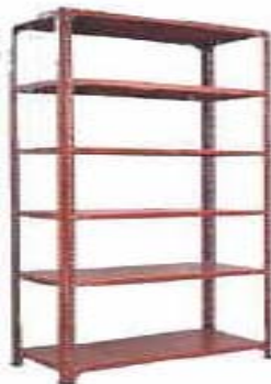
Rys. nr 3. Regał stacjonarny