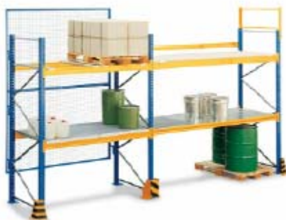
Rys. nr 2. Regał paletowy

Regały paletowe o wysokości słupów 2500mm i głębokości ramy 600mm z perforacją, co 50mm, każdy słup nośny mocowany jest do posadzki kotwami M12 x 100 mm (po1 kotwie na słup). Regały przeznaczone są do składowania palet o wym. 550mm x 870mm i ciężarze do 600 kg na poziomach 0 + 1. Belkowe poziomy składowania mają długość: 2700mm i 1800mm.