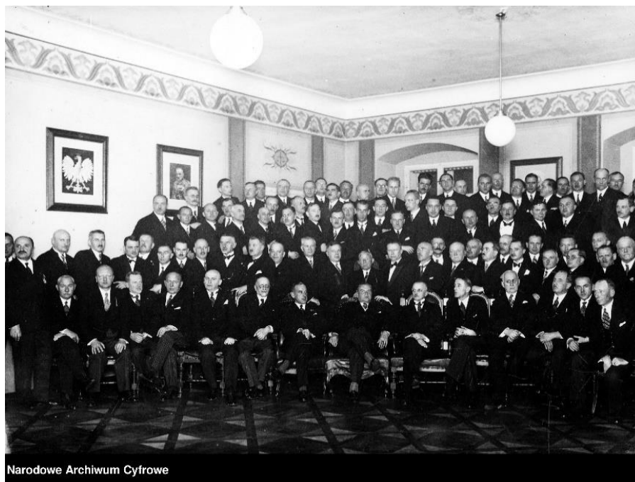
Minister sprawiedliwości Czesław Michałowski wśród pracowników wymiaru sprawiedliwości.