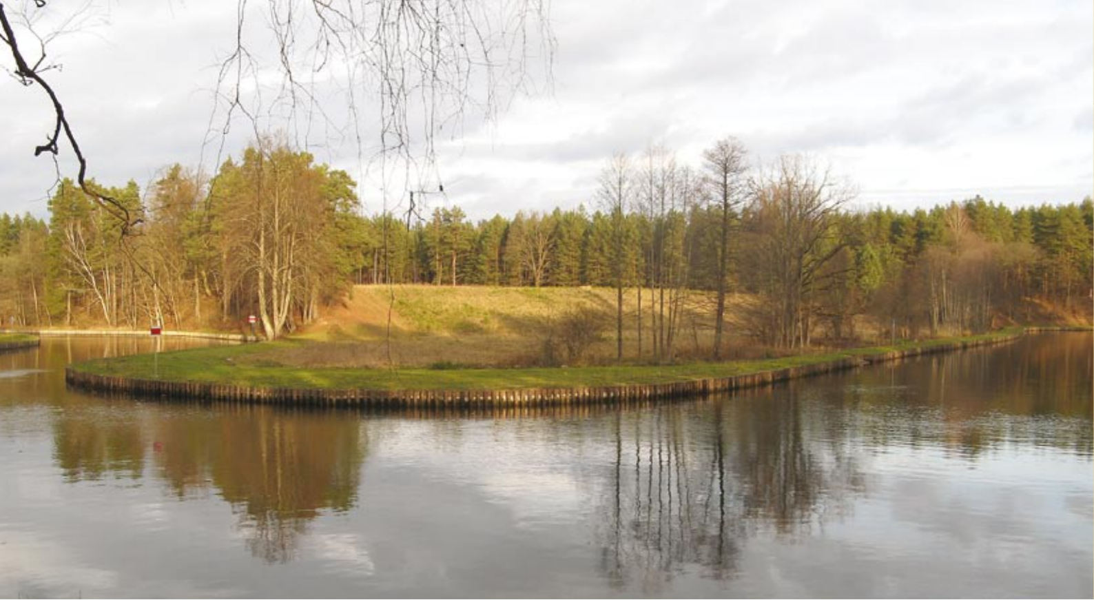
Le Canal d'Augustów, après la rénovation financée par les fonds de NFOŚiGW. (abréviation NFOŚiGW signifie: Fonds National pour la Protection de l'Environnement et la Gestion de l'Eau)

Le Fonds National pour la Protection de l'Environnement et la Gestion de l'Eau qui fête 20 ans d'existence, est, concurrentiellement avec les autres fonds de voivodie, colonne du système polonais de financement de protection de l'environnement. Le fonctionnement du Fonds National base sur la loi de protection de l'environnement.