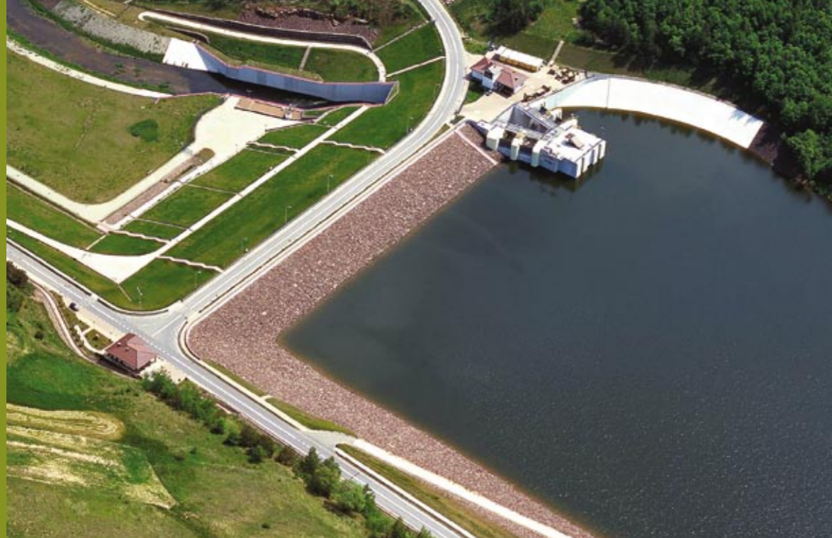
Le réservoir financé par NFOŚiGW. Vue aérienne des copeaux.