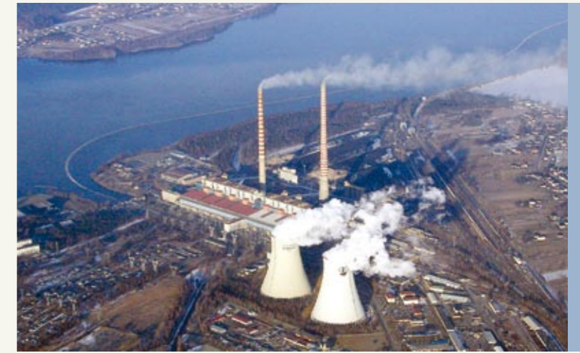
Opérateur National du Système des Investissements Verts dans le cadre du commerce international des droits à l'émission des gaz à effet de serre – c'est une nouvelle tâche du NFOŚiGW.

étrangers desservis par le Fonds National, les démarches de protection de l'environnement et la gestion de l'eau ont été alimentées en 2008 par le montant record de 4,6 mld PLN . En 2009 nous prévoyons l'augmentation de ce montant jusqu'à 7 mld PLN .