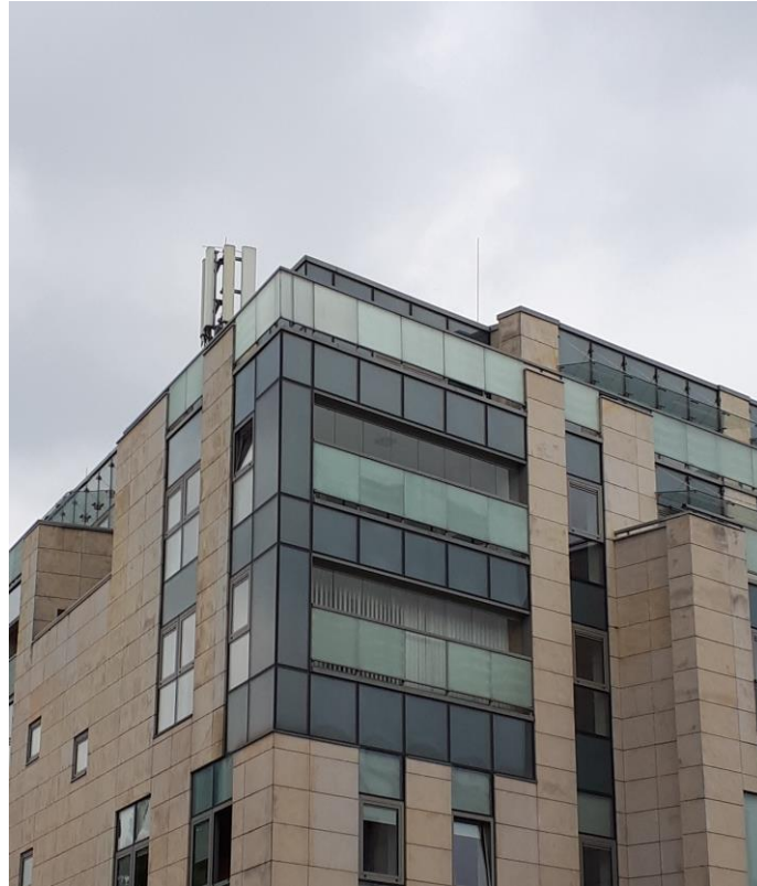
Fot. 1: Widok anten stacji bazowej ID: ZGO1001, zlokalizowanej pod adresem: pl. Jana Matejki 19, 65-056 Zielona Góra