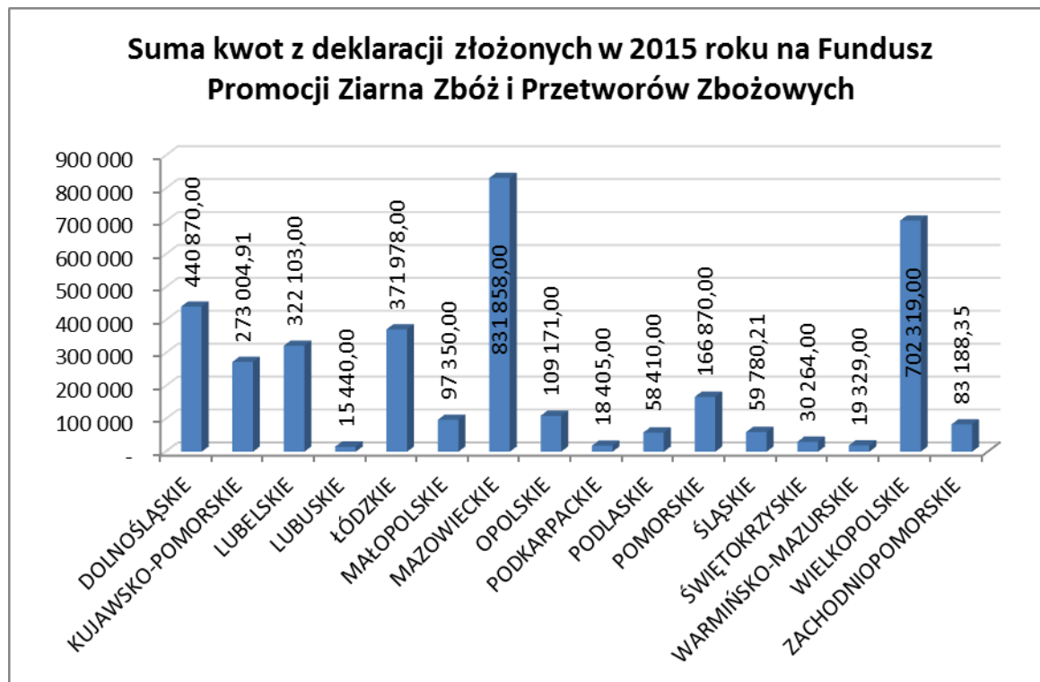
Wykres nr 2. Wysokość kwot zadeklarowanych przez podmioty za 2015 rok.

Różnica pomiędzy kwotą zadeklarowaną, a wpłaconą jest spowodowana tym, że wpłaty fizycznie zasiliły rachunek bankowy funduszu w 2015 roku (są to wpłaty za czwarty kwartał 2014 i pierwsze trzy kwartały roku 2015), natomiast kwoty zadeklarowane dotyczą deklaracji złożonych za cztery kwartały 2015 roku. Wartość kwot zadeklarowanych podlega dodatkowo zmianom w skutek: korekt deklaracji, kontroli, składanych z opóźnieniem deklaracji przez przedsiębiorców, itd.