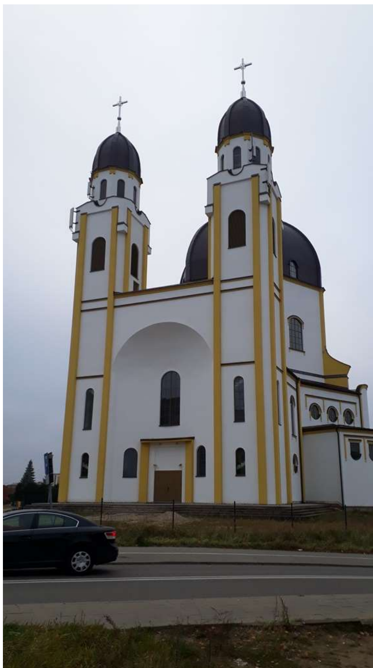
Fot. 1: Widoki anten stacji bazowej ID: BT13114, zlokalizowanej: ul. Pułaskiego 94, 15-338 Białystok