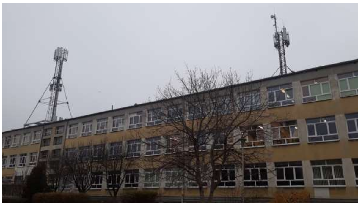
Fot. 1: Widoki anten stacji bazowych ID: BYD1097 oraz ID: BT42719, zlokalizowanych: ul. Karpacka 30, 85-164 Bydgoszcz