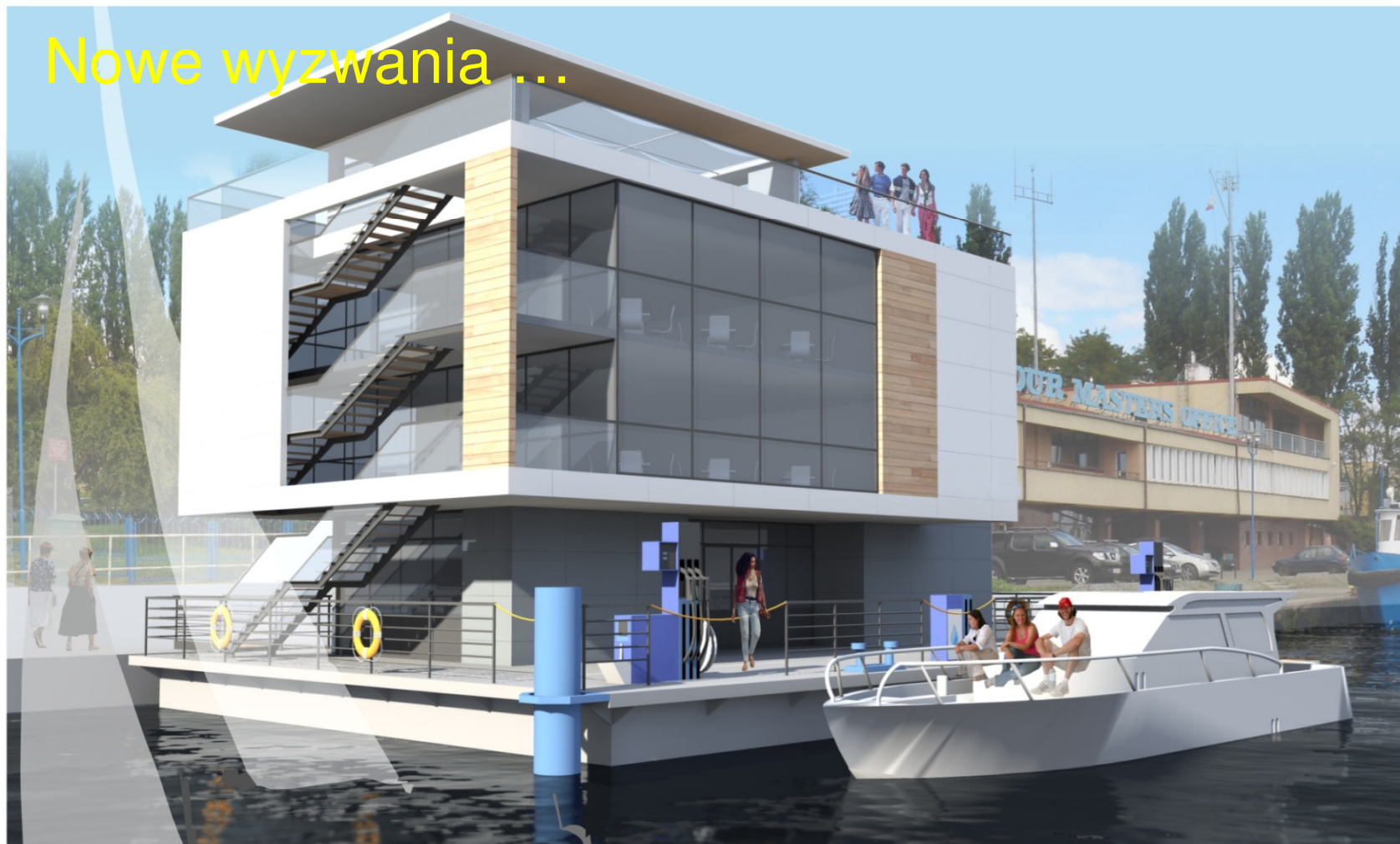
widok w kierunku kapitanatu portu