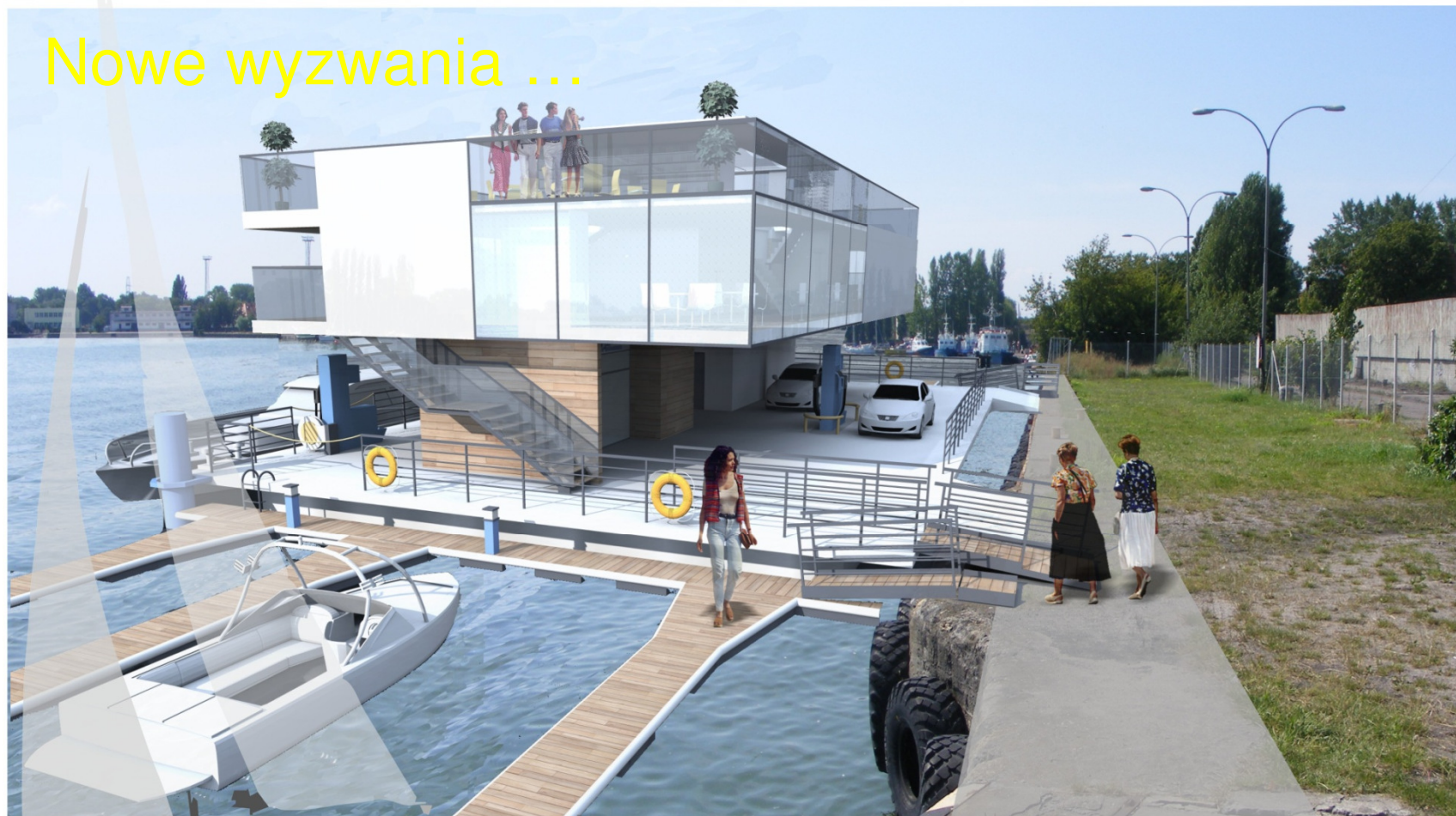
widok od strony nabrzeża