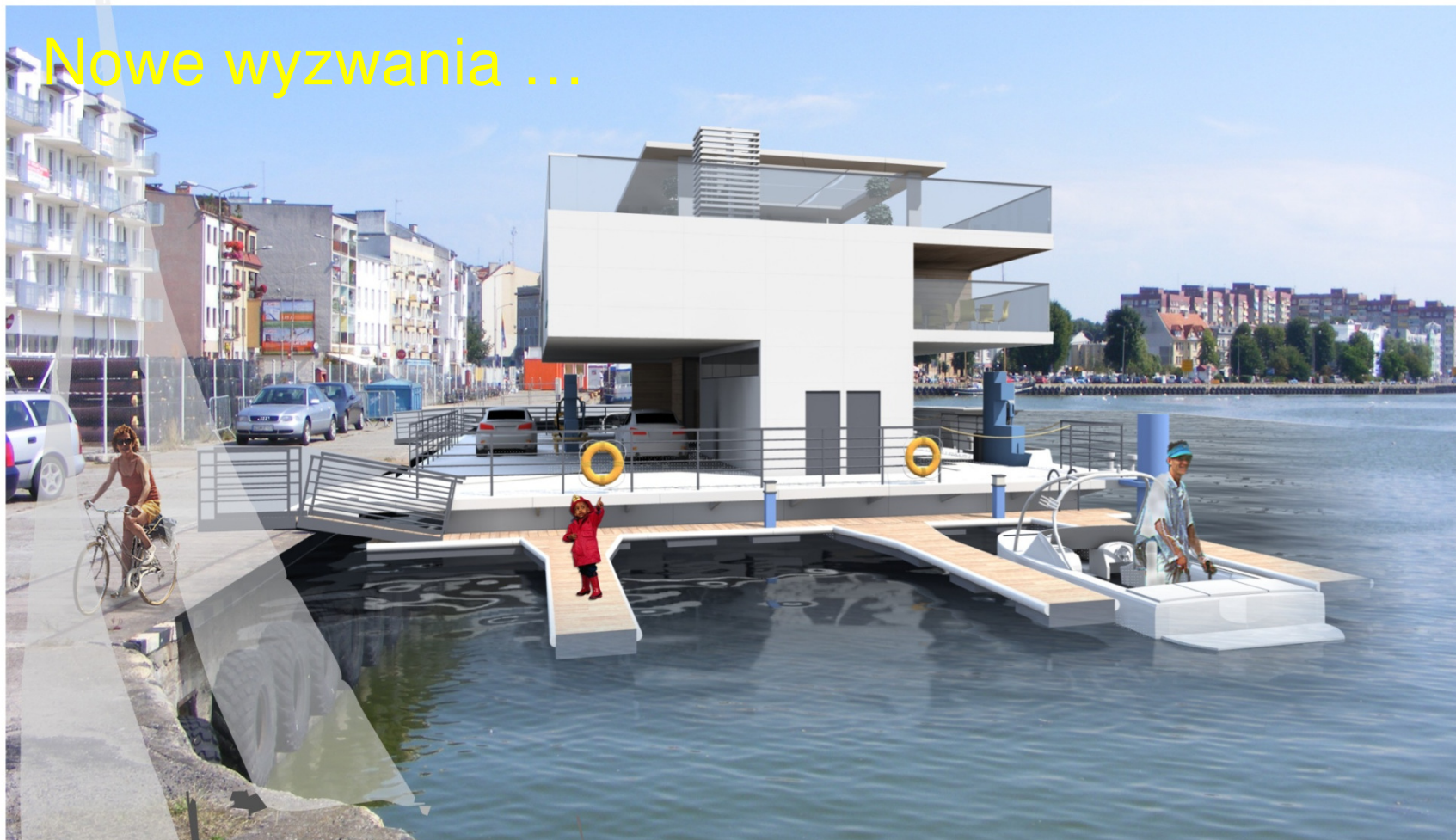
widok w kierunku centrum miasta