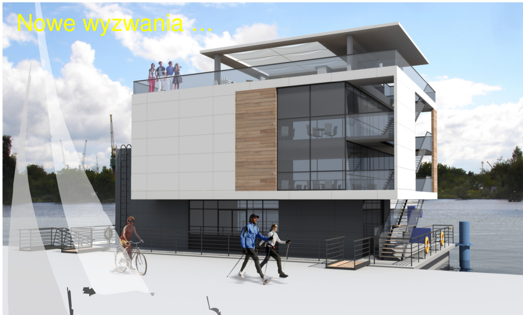
widok od strony nabrzeża