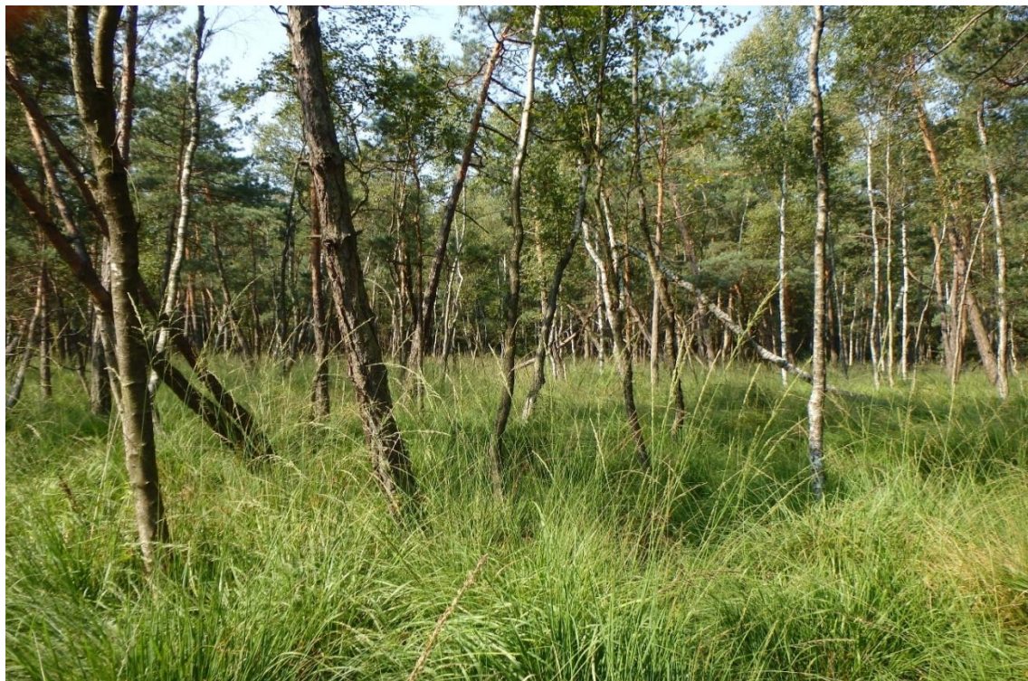
Fot. 2. Widok ogólny stanowiska (rezerwat przyrody „Prądy”).