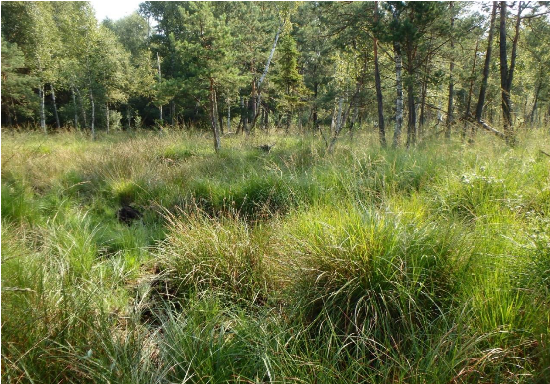
Fot. 1. Widok ogólny stanowiska (rezerwat przyrody „Prądy” teren silnie podmokły i bagienny).