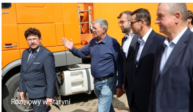
Rozmowy w Staryni