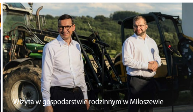
Wizyta w gospodarstwie rodzinnym w Miłoszewie