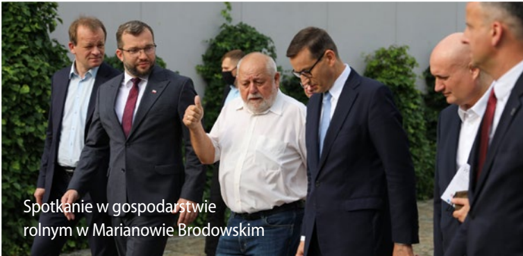
Spotkanie w gospodarstwie rolnym w Marianowie Brodowskim