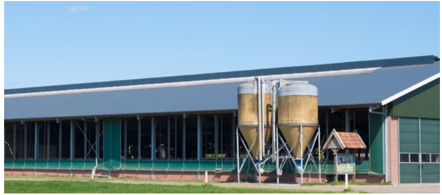
Rozszerzono również zakres interwencji „Inwestycje w gospodarstwach rolnych”