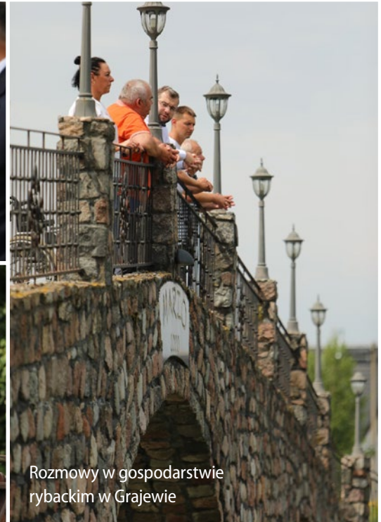
Rozmowy w gospodarstwie rybackim w Grajewie

Zostanie rozszerzona na cały kraj strefa sprzedaży produktów w systemie rolniczego handlu detalicznego. Ponadto zwiększona zostanie kwota wolna od podatku z 40 tys. do 100 tys. zł. w skali roku. Dodatkowo dywersyfikacja i skrócenie łańcucha dostaw produktów rolnych i spożywczych oraz dofinansowanie małych ubojni będzie szansą na rozwój owczarstwa oraz wzrost zainteresowania konsumentów jagnięciną i produktami owczymi. Rozwiązania w tym zakresie zostały uwzględnione w Polskim Ładzie oraz Krajowym Planie Odbudowy i Zwiększenia Odporności.