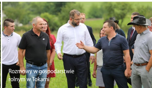
Rozmowy w gospodarstwie rolnym w Tokarni