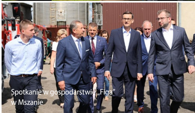
Spotkanie w gospodarstwie „Figa” w Mszanie

łańcuchu żywnościowym oraz skracanie łańcuchów dostaw i łańcuchów sprzedaży to według szefa resortu rolnictwa priorytetowe zadania.