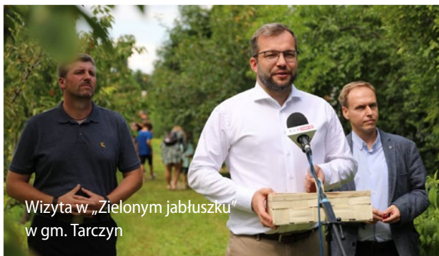
Wizyta w „Zielonym jabłuszku” w gm. Tarczyn