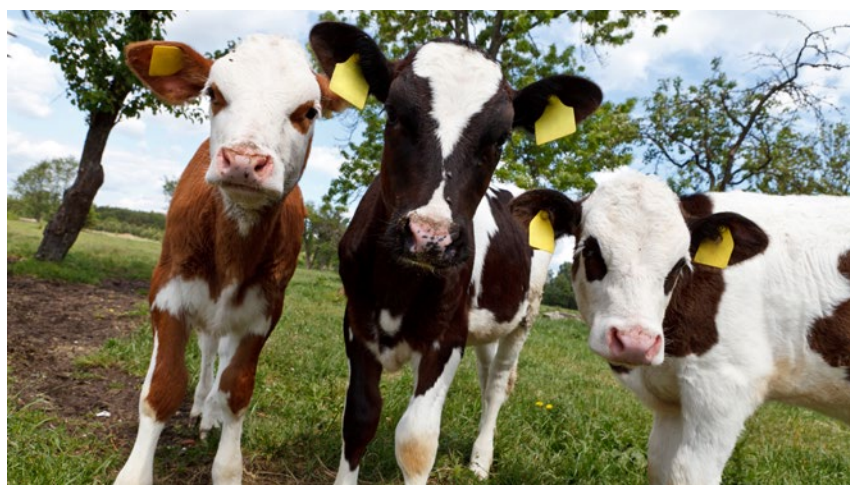
W Planie Strategicznym dla Wspólnej Polityki Rolnej na lata 2023–2027 zmieniono m.in. warunki przyznawania płatności związanych do młodego bydła i do krów

Dla osiągnięcia założonych celów, w Ministerstwie Rolnictwa i Rozwoju Wsi, trwały wielomiesięczne prace zespołów, skupiające m.in. środowiska eksperckie i naukowe, zaangażowane do oceny stanu, identyfikacji potrzeb w rolnictwie i na obszarach wiejskich oraz zaproponowania sposobu ich realizacji. Rozwiązania te zostały ujęte w pierwszej wersji projektu Planu Strategicznego WPR na lata 2023–2027.