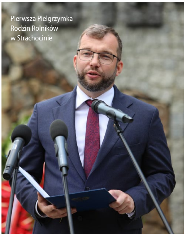
Pierwsza Pielgrzymka Rodzin Rolników w Strachocinie

W bacówce na zboczach Przełęcz Rozdziela, minister Puda rozmawiał z bacami i juhasami o pasterskich tradycjach, polskiej jagnięcinie i możliwościach rozwoju sprzedaży produktów owczych. Takie możliwości będą dawały nowe regulacje zawarte w Polskim Ładzie .