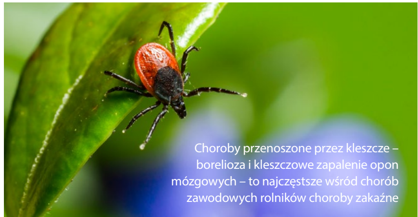
Choroby przenoszone przez kleszcze – borelioza i kleszczowe zapalenie opon mózgowych – to najczęstsze wśród chorób zawodowych rolników choroby zakaźne

Do zakażenia boreliozą dochodzi zazwyczaj nie wcześniej niż 24 godziny od ukłucia; jeśli na skórze