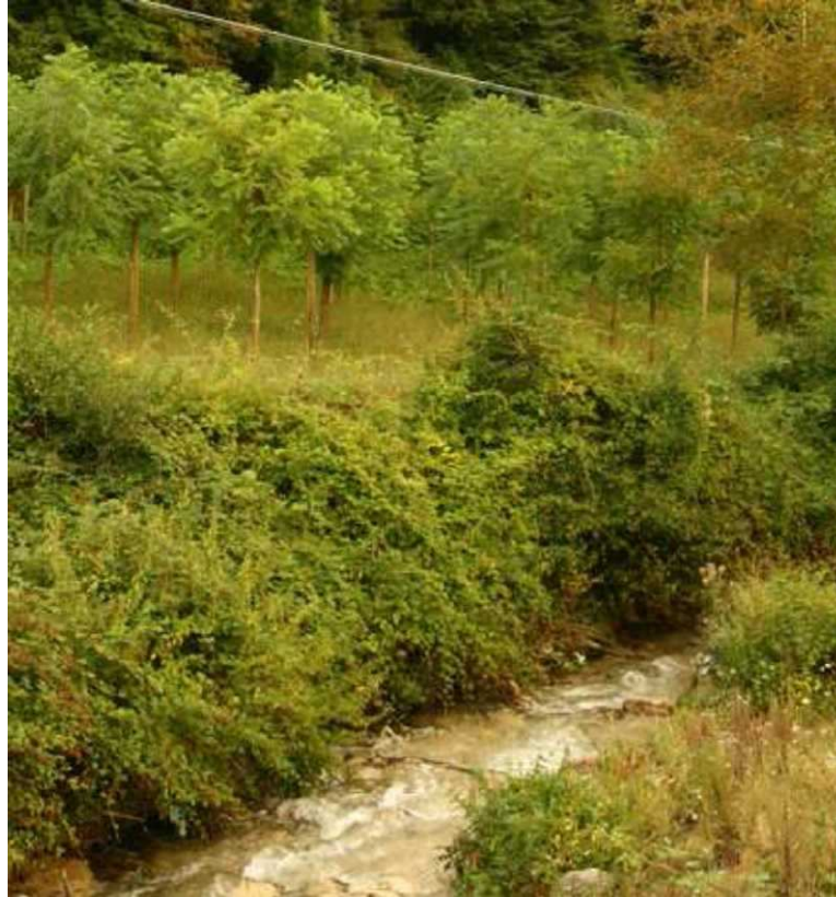
Zdjęcie: Plantacja Ailanthus altissima w pobliżu rzeki