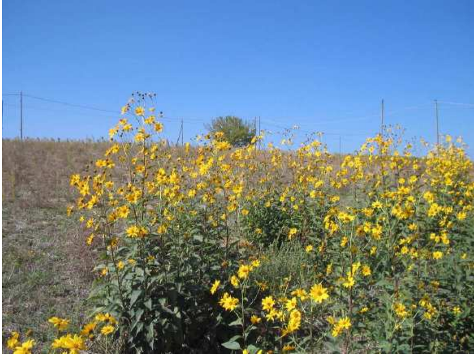
Zdjęcie: Helianthus tuberosus wymknął się spod kontroli, nie wyrządzając jednak szkód siedliskom naturalnym