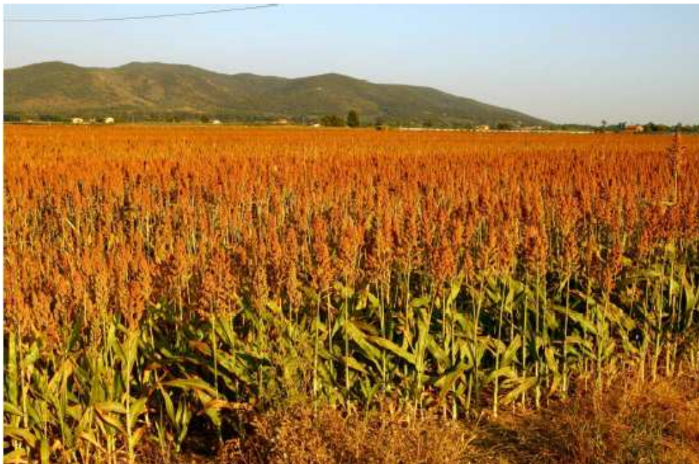
Uprawy słodkiego sorgo w Toskanii. Trwają badania mające na celu monitorowanie rozprzestrzeniania się zbioru materiału genetycznego w otoczeniu terenów zielonych.