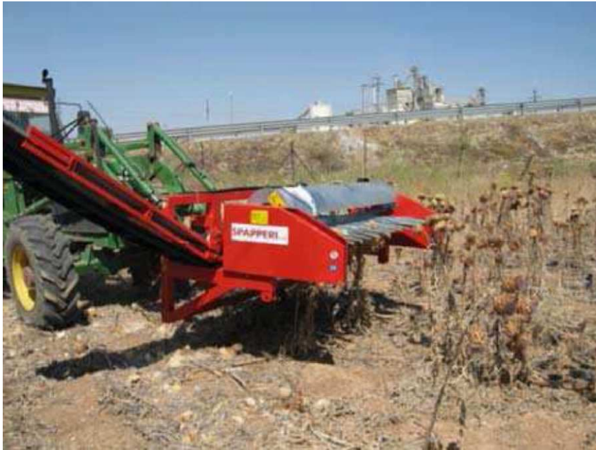
Prototyp maszyny do zbiorów karczocha