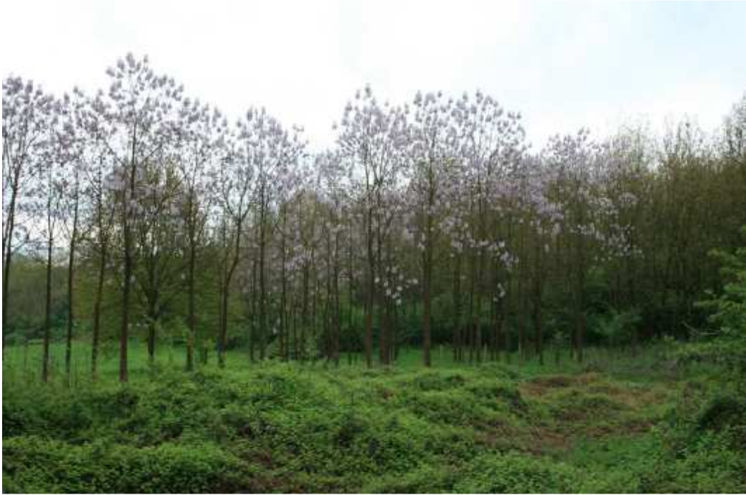
Paulownia tomentosa uprawa pod materiał na produkcję biopaliw