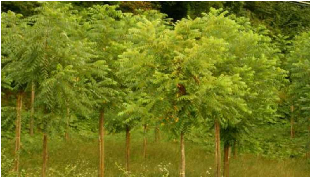
Chwast Ailanthus altissima występujący "wszędzie" i nadal proponowany jako uprawy energetyczne