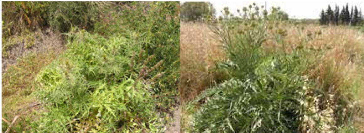
Zdjęcie: Karczoch odmiana dzika (z lewej) i karczoch przeznaczony na produkcję biopaliw (zdjęcia wykonane jednego dnia w tej samej okolicy)