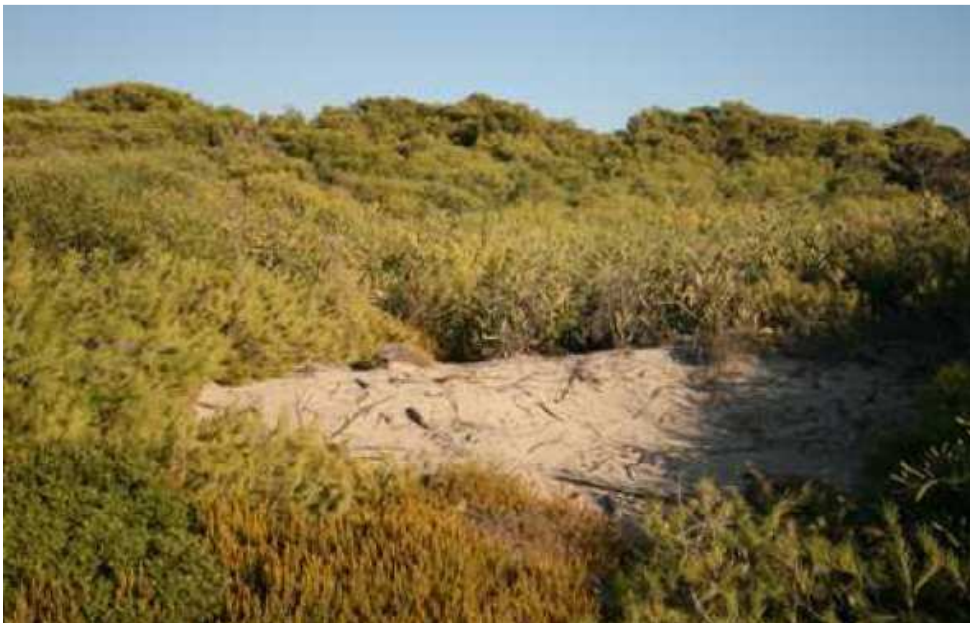
Zdjęcie: Acacia saligna powodująca szkody w naturalnym ekosystemie śródziemnomorskich wydm piaszczynowych