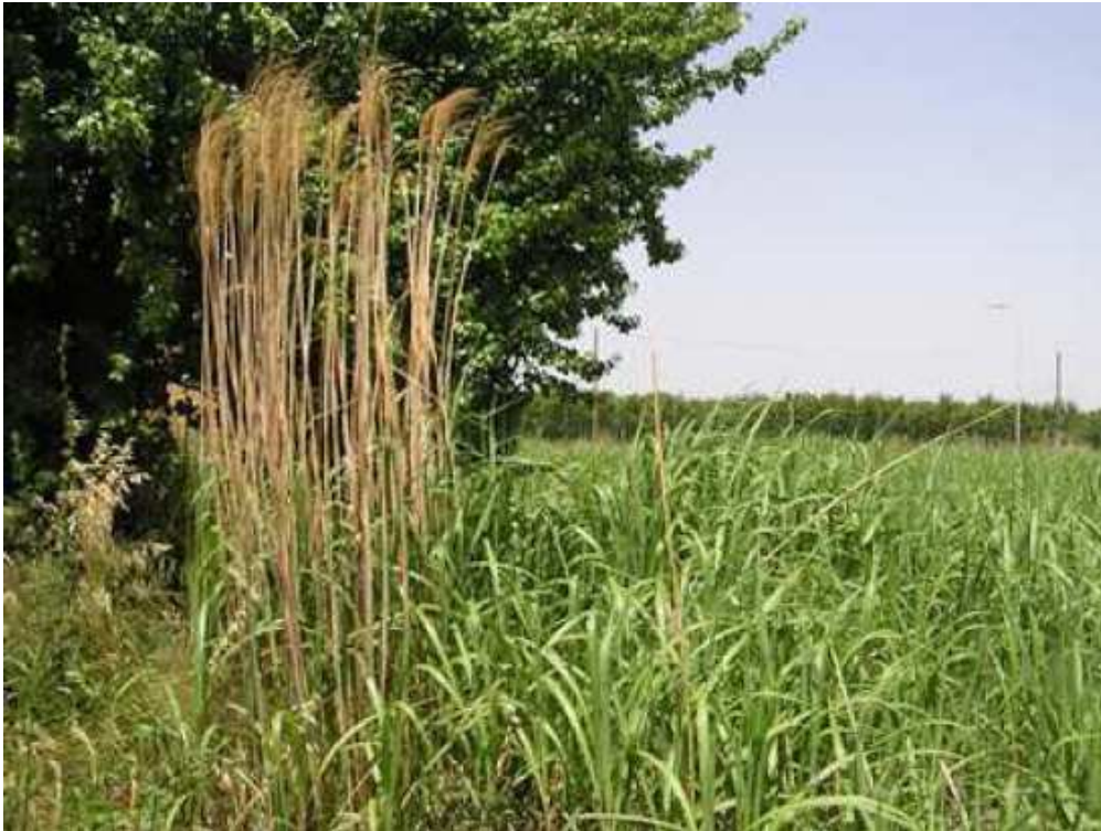
Allopoliploid Miscanthus x giganteus , który nie wytwarza nasion zdolnych do życia (rozmnaża się wegetatywnie, tak jak zostało przedstawione to na zdjęciu)