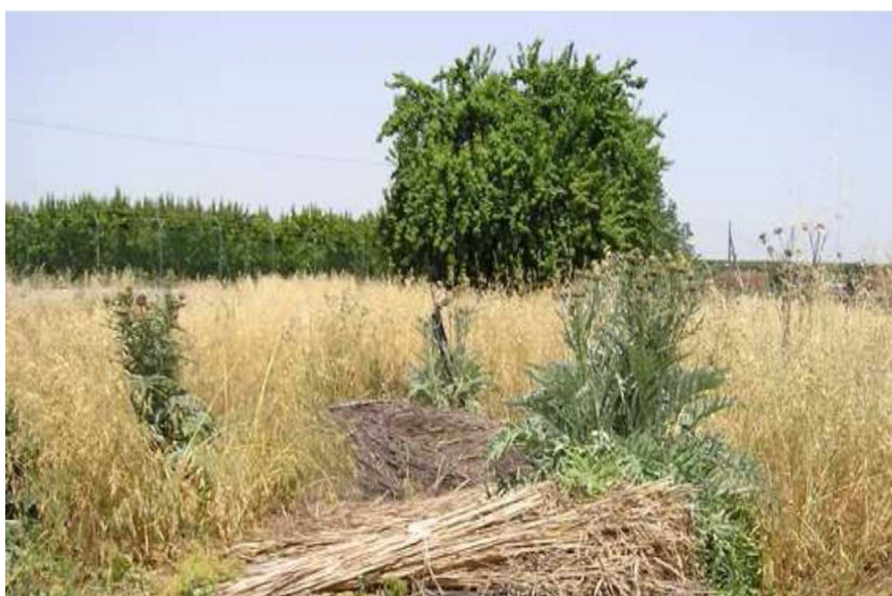
Zdjęcie: Karczoch ostowy przeznaczony na produkcję biopaliw, który wymknął się z pola spod kontroli