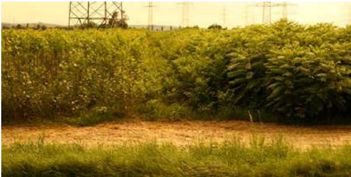
Zdjęcie: Plantacja topoli i bożodrzewu w pobliżu brzegów rzeki Dunaju

W rezultacie pomiędzy polami uprawnymi i roślinnością naturalną (lub korytarzami ekologicznymi, które są "wyjątkowymi ścieżkami") powinna powstać strefa buforowa, która funkcjonowałaby jako określona bariera biologiczna dla upraw inwazyjnych. Na polach uprawnych strefa buforowa może zostać ustalona z innymi (nieinwazyjnymi) uprawami gleby lub poprzez okresowe oranie gleby. Strefy buforowe powinny być określone (w celu zmniejszenia rozprzestrzeniania się wyłącznie niepożądanego zbioru materiału genetycznego)