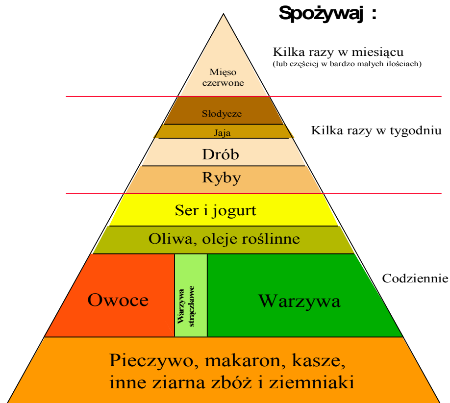
Model zdrowego żywienia wg piramidy żywienia śródziemnomorskiego

Opracowanie: Szponar L., Mojska H. (red.): Żywność i zdrowie człowieka. Instytut Żywności i Żywienia, Warszawa 1996