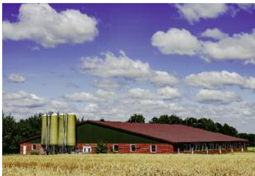
Na wsparcie z działania „Modernizacja gospodarstw rolnych” zakontraktowano już 5,8 mld złotych. Pomoc przyznawana jest w postaci refundacji poniesionych kosztów na realizację danej inwestycji