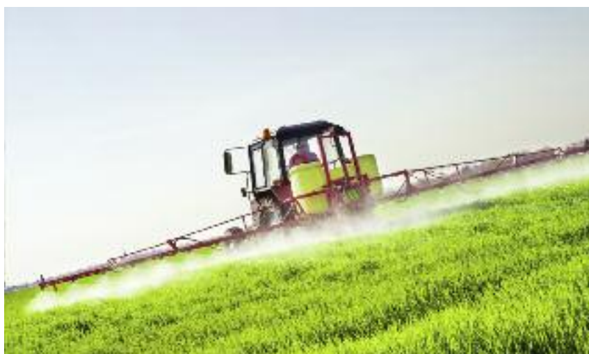
Ustawa wprowadza zakaz stosowania mocznika bez inhibitora ureazy albo bez otoczki biodegradowalnej. Zakaz ten będzie obowiązywał od 1 sierpnia 2021 r., co zapewni odpowiednio długi okres przejściowy

Stosowanie mocznika z inhibitorem ureazy albo mocznika z powłoką biodegradowalną realizuje wymagania określone w przepisach tzw. dyrektywy NEC oraz wspiera realizację tzw. dyrektywy azotanowej. Ponadto ograniczanie emisji amoniaku do atmosfery jest zgod-