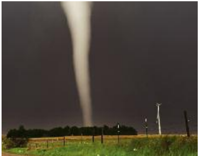
Do końca sierpnia br. mają czas na złożenie wniosku rolnicy, którzy ponieśli w gospodarstwach straty spowodowane klęskami żywiołowymi bądź wystąpieniem ASF

pomocy lub w co najmniej jednym z dwóch lat poprzednich. Wysokość strat w uprawach rolnych, zwierzętach gospodarskich czy rybach uprawiająca do starania się o pomoc musi wynieść co najmniej 30 proc. średniej rocznej produkcji rolnej oraz straty te muszą dotyczyć składnika gospodarstwa, którego odtworzenie wymaga poniesienia kosztów kwalifikujących się do objęcia wsparciem. Wysokość poniesionych strat, jakie powstały w gospodarstwie, określa komisja powołana przez wojewodę.