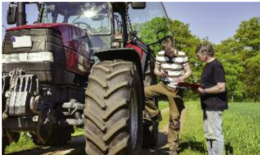
Wnioski o oszacowanie strat spowodowanych przez suszę producenci rolni mogą składać wyłącznie za pomocą publicznej aplikacji