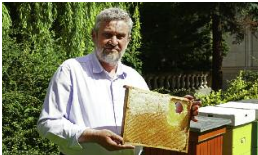
Minister Jan Krzysztof Ardanowski prezentuje plaster miodu pochodzący z uli stojących na dziedzińcu Ministerstwa Rolnictwa i Rozwoju Wsi

Przy okazji kolejnego miodobrania minister Ardanowski zwrócił uwagę, że coraz więcej instytucji w miastach ustawia ule na swoim terenie, często na dachach budynków.