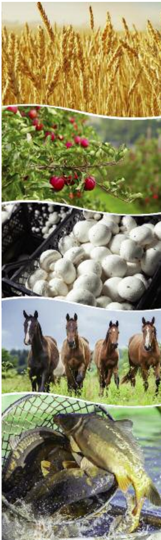
Powierzchnia upraw objętych systemem rolnictwa ekologicznego w Polsce w 2019 r. wyniosła 505,7 tys. ha

W produkcji zwierzęcej zanotowano ogólny wzrost pogłowia zwierząt z 400 do 550 tys. szt. Ilość bydła wzrosła z 27 do 30,1 tys. (11%), świń