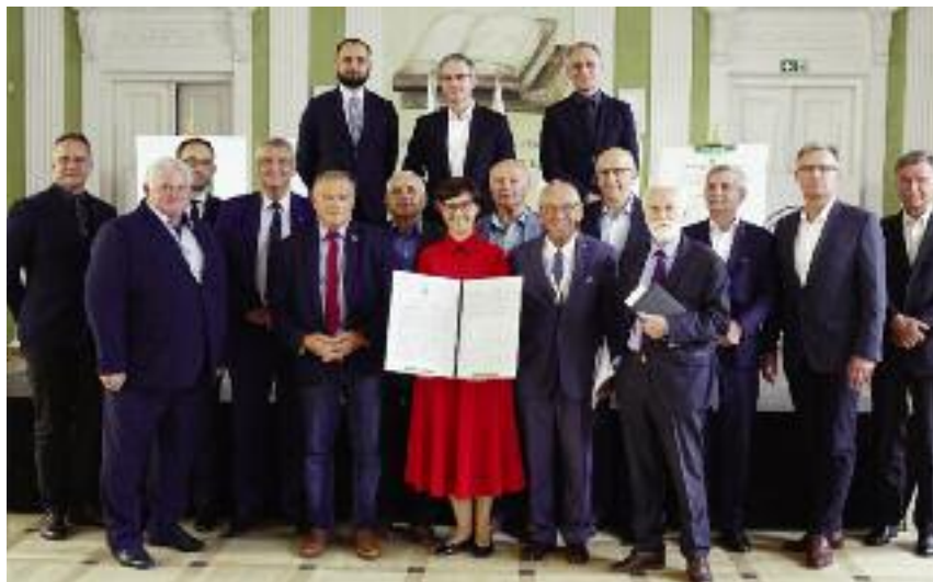
W czasie konferencji Kodeks został podpisany przez przedstawicieli kolejnych związków i organizacji branżowych włączających się w tę ideę

W konferencji wzięli udział: Artur Pollok, Ambasador – Stały Przedstawiciel Rzeczypospolitej Polskiej przy Organizacji Narodów Zjedno-