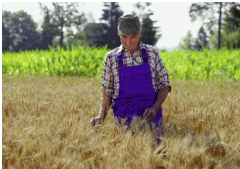
Emeryci i renciści z KRUS mają prawo do trzynastej emerytury i waloryzacji świadczeń

W ramach projektu „Odpoczywaj na wsi” zorganizowano łącznie 19 seminariów, szkoleń i konferencji, w których udział wzięło 671 osób (materiały szkoleniowe dostępne są na stronie www.odpoczywajnawsi.pl ) i Forum Turystyki Wiejskiej i Agroturystyki, w którym uczestniczyło ponad 500 osób (łącznie 1171).