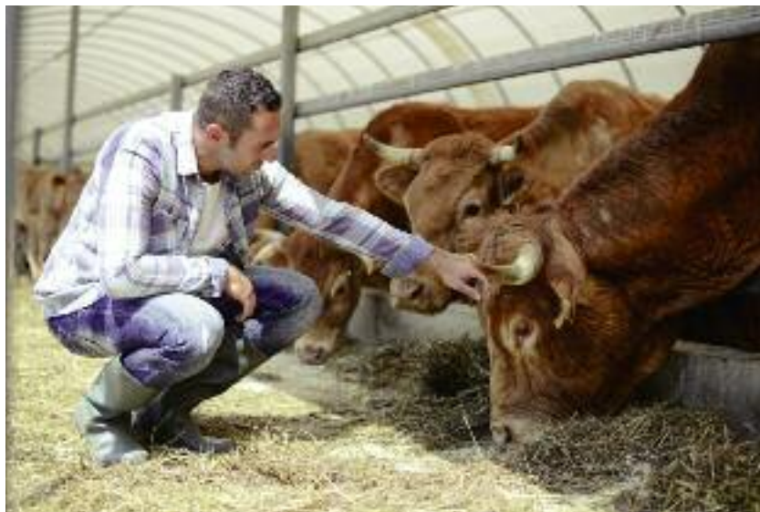
W 2020 r. po raz pierwszy w Polsce zostało uruchomione działanie „Dobrostan zwierząt”, obejmujące sektory bydła i trzody chlewnej. Na realizację przeznaczono 50 mln euro

pomocy dla rolników w sektorach najbardziej dotkniętych skutkami COVID-19 – w formie jednorazowej płatności ryczałtowej (do 7 tys. euro na gospodarstwo). Będzie to prosta forma wsparcia, nie zwiększająca obciążeń administracyjnych dla rolników.