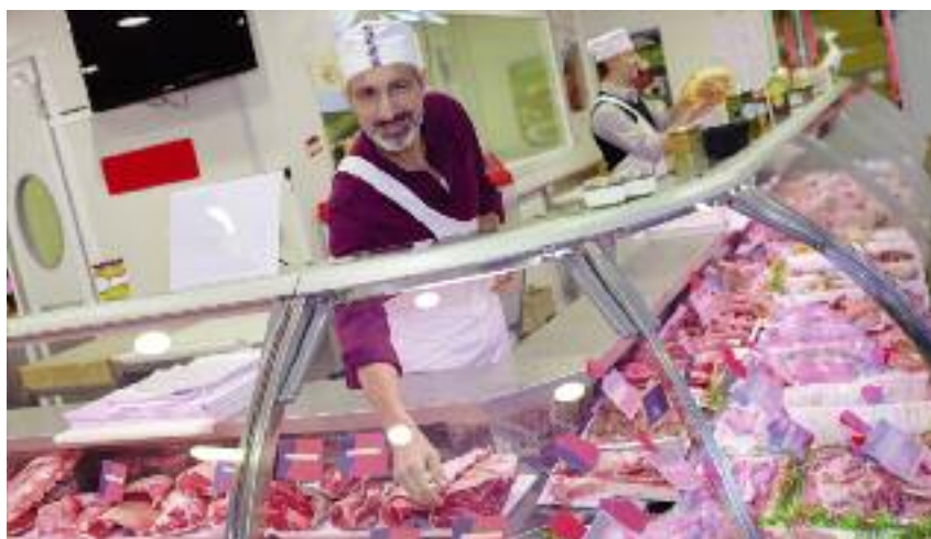
30 września br. zaczną obowiązywać przepisy nakładające obowiązek znakowania mięsa sprzedawanego na wagę grafiką przedstawiającą flagę kraju pochodzenia produktu

Wymóg ten stanowi rozszerzenie obowiązku podawania informacji dotyczących państwa pochodzenia w przypadku nieopakowanego świeżego, schłodzonego i zamrożonego mięsa ze świń, owiec, kóz i drobiu wprowadzonego przepisem rozporządzenia Ministra Rolnictwa i Rozwoju Wsi z 18 grudnia 2017 r. zmieniającym rozporządzenie w sprawie