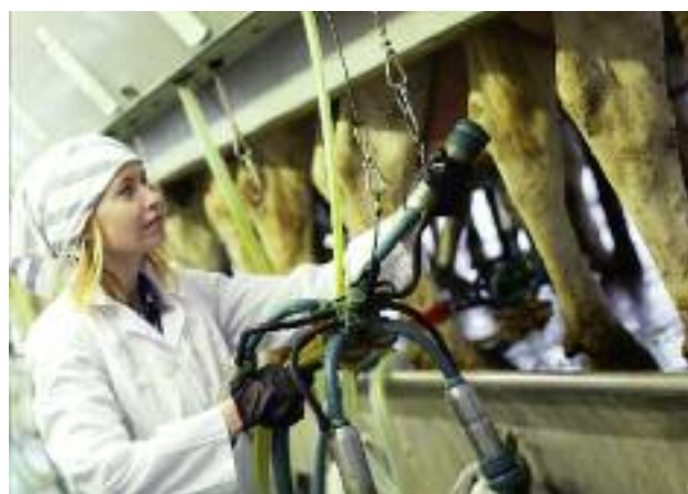
17 sierpnia 2020 r. upływa termin na złożenie wniosku o wsparcie na „ Tworzenie grup producentów i organizacji producentów ”. Pomoc przyznawana jest w okresie pierwszych 5 lat działania grupy liczonej od dnia jej uznania