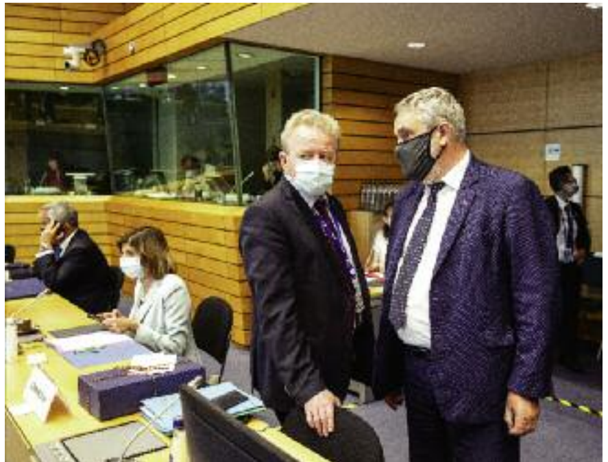
Minister Jan Krzysztof Ardanowski i komisarz UE ds. Rolnictwa i Rybołówstwa Janusz Wojciechowski w czasie lipcowych obrad AGRIFISH

Na rynku wieprzowiny, po krótkiej stabilizacji cen ponownie notuje się tendencję spadkową. Polska zawnioskowała o ponowną analizę możliwości wprowadzania interwencji rynkowej.