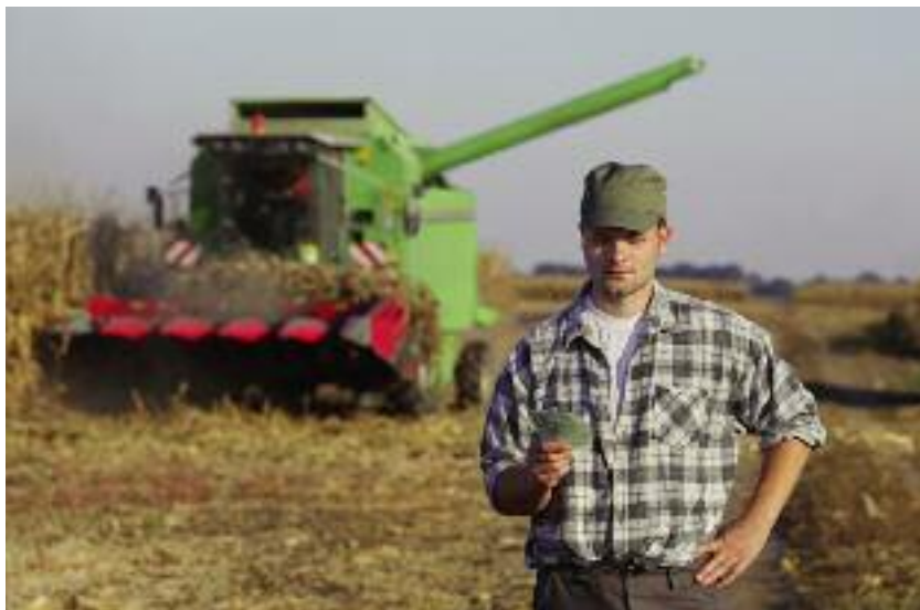
Od 2019 r. kwota premii dla młodego rolnika wynosi 150 tys. złotych

poniesionych na dobraną do potrzeb gospodarstwa infrastrukturę.