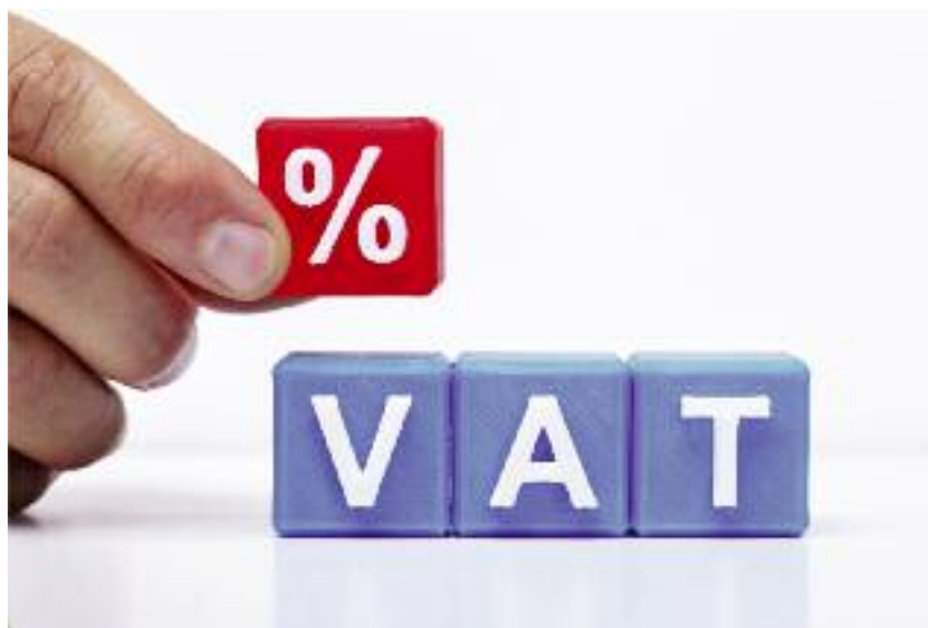
Obniżone stawki podatku VAT w wysokości 5% i 8% na produkty rolne i środki niezbędne w gospodarstwie zostały przeniesione z rozporządzenia Ministra Finansów do ustawy VAT-owskiej

W załączniku nr 10 określono wykaz towarów i usług opodatkowanych stawką podatku w wysoko-