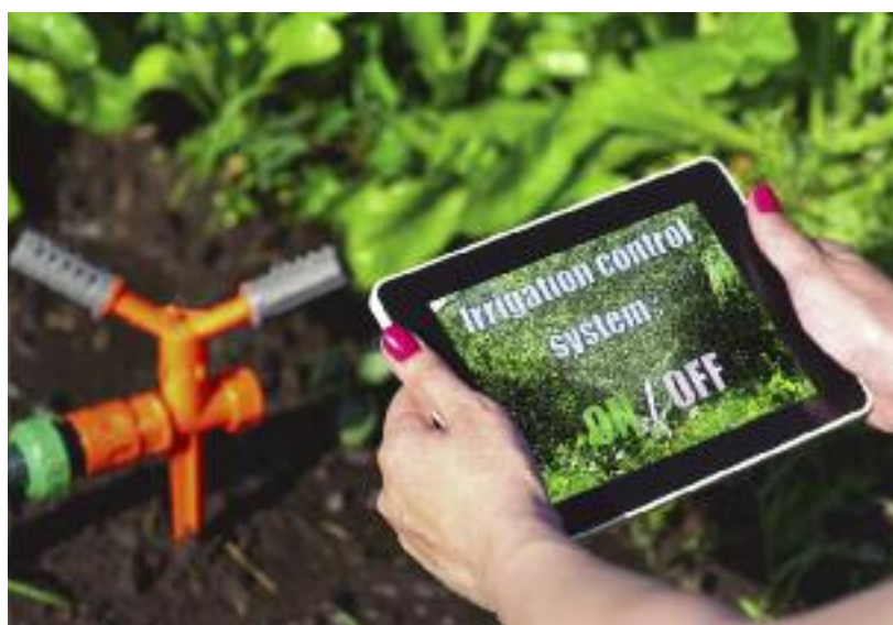
Wprowadzono dodatkowy obszar wsparcia związany z nawadnianiem w gospodarstwach

W związku z COVID-19 zapewniono bezpieczeństwo żywnościowe i zagwarantowano stabilność łańcucha dostaw produktów żywnościowych. Uruchomiono 11 instrumentów wsparcia na rynkach rolnych, w tym dopłaty do prywatnego przechowywania przetworów mlecznych (masła, odtłuszczonego mleka w proszku