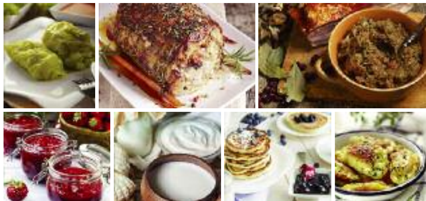
Nasze dziedzictwo kulinarne jest bardzo bogate – specjały poszczególnych regionów, smakołyki i miejscowe dania łączące często smaki różnych kuchni. Czy trzeba czegoś więcej? Proponujemy „Polskę smakować w turystyce”!

– Polskie obszary wiejskie kojarzone są z gościnnością, dziedzictwem kulturowym, bogactwem natury, wspaniałą kuchnią bazującą na naturalny składnikach. Jestem przekonany, że dzięki wspólnym