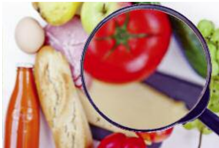
Kontrolę jakości handlowej artykułów rolno-spożywczych w obrocie detalicznym od 1 lipca 2020 r. sprawuje IJHARS

Na koniec warto nadmienić także, że od 1 lipca 2020 r. IJHARS przestał być organem