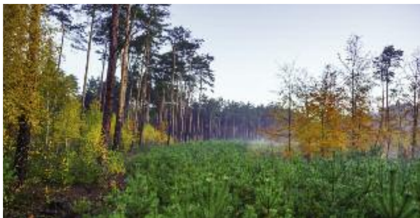
Od 3 sierpnia do 11 września br. trwać będzie kolejny, trzeci już nabór wniosków o pomoc w ramach poddziałania „Wsparcie na inwestycje zwiększające odporność ekosystemów leśnych i ich wartość dla środowiska”, objętego PROW 2014-2020

Szczegółowe informacje na temat poddziałania „Wsparcie na inwestycje zwiększające odporność ekosystemów leśnych i ich wartość dla środowiska PROW 2014-2020” znajdują się stronie internetowej MRiRW.