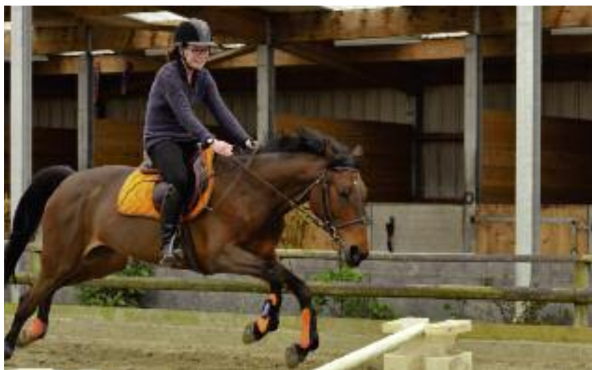
... oraz szeroki i oryginalny wachlarz zajęć pozalekcyjnych, np. koło jeździeckie

• profesjonalni i przyjaźnie nastawieni nauczyciele, zawodowcy z bogatym doświadczeniem, którzy przygotowują młodzież do umiejętnego prowadzenia i zarządzania nowo-