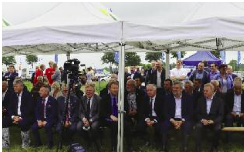
Oficjalne otwarcie Krajowych Dni Pola

Departament Strategii, Transferu Wiedzy i Innowacji MRiRW ☎ 22 623 21 20