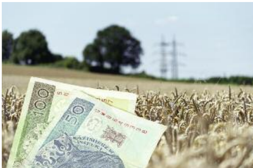
Corocznie w ramach zaliczek na płatności bezpośrednie, w ciągu zaledwie półtora miesiąca (zaliczki mogą być wypłacane od połowy października do końca listopada roku złożenia wniosku), do polskich rolników trafia ponad 9 mld zł

w ramach zaliczek, w ciągu zaledwie półtora miesiąca (zaliczki mogą być wypłacane od połowy października do końca listopada roku złożenia wniosku), do polskich rolników trafia ponad 9 mld zł.