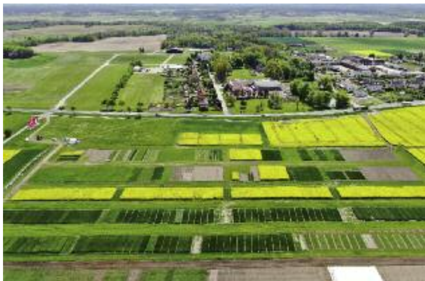
Krajowe Dni Pola Minikowo 2020 - widok z drona

i hodowli nasiennych, jak i z niezależną kolekcją ok. 200 poletek firmy Rolnas. Zaprezentowane zostały także poletka odmian roślin uprawnych w ramach Porejestrowego Doświadczalnictwa Odmianowego w Chrzęstowie (ok. 12 km od Minikowa) i kolekcja roślin w Grubnie k. Chełmna. W sumie na ponad 14 ha zaprezentowano odmiany rzepaku ozimego, zbóż ozimych i jarych, buraków cukrowych, ziemniaków, kukurydzy, roślin bobowatych, traw i ich mieszanek oraz mieszanek poplonowych,