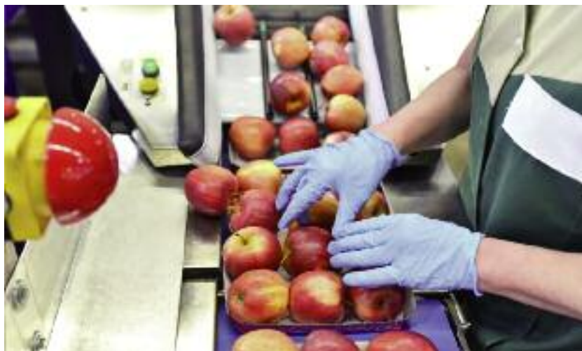
Podniesiono procentowe stawki pomocy w poszczególnych latach funkcjonowania grupy producentów rolnych do: 10% w pierwszym roku, 9% w drugim roku, 8% w trzecim roku, 7% w czwartym roku, 6% w piątym roku

Od czerwca 2019 r., w ramach wsparcia dla „dużego przetwórstwa”, które wynosi do 10 mln zł na beneficjenta, producenci pasz niewykorzystujący w produkcji