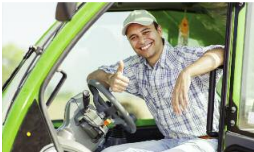
Ksztalcenie w resortowych szkołach rolniczych jest idealnym miejscem dla wszystkich, którzy wiążą swoją przyszłość z rolnictwem

Oczekiwaniem resortu rolnictwa jest, aby przejetae szkoly rolnicze stanoily swoiste centrum edukacji rol-