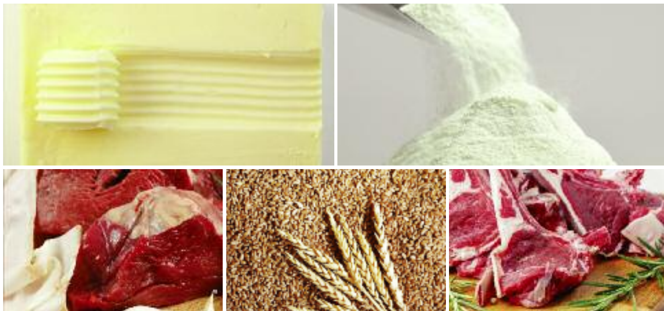
W celu przeciwdziałania niestabilnej sytuacji na rynkach rolnych uruchamiane są w państwach UE zakupy interwencyjne oraz dopłaty do prywatnego przechowywania towarów rolno-spożywczych. Mechanizmy te realizowane przez KOWR stanowią wielką pomoc dla branży mlecznej i mięsnej

Wieloletnie obserwacje pokazują, że pojawiające się kryzysy są zazwyczaj zjawiskiem nagłym i charakteryzującym się dużą gwałtownością, a mechanizmy interwencyjne, przy jednoczesnej złożoności samego procesu realizacji, należą do działań dynamicznych i masowych, a zatem wymagających zaangażowania znacznych zasobów ludzkich. Z racji takiej specyfiki bardzo ważne