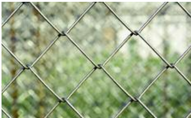
3 sierpnia 2020 r. rusza nabór wniosków o przyznanie wsparcia na inwestycje zwiększające odporność ekosystemów leśnych i ich wartość dla środowiska. Dodatkowe dofinansowanie można otrzymać m.in. na ogrodzenie remizy siatką metalową o wysokości minimum 2 m.

Pomocą objęte są lasy prywatne w wieku 11-60 lat – o powierzchni od 0,1 ha do 20 ha – stanowiące własność lub współwłasność wnioskodawcy lub własność jego małżonka, które nie są objęte premią pielęgnacyjną PROW i dla których opracowany jest „Uproszczony plan urządzenia lasu”, lub dla których zadania z zakresu gospodarki leśnej określa decyzja starosty wydana na podstawie inwentaryzacji stanu lasu.