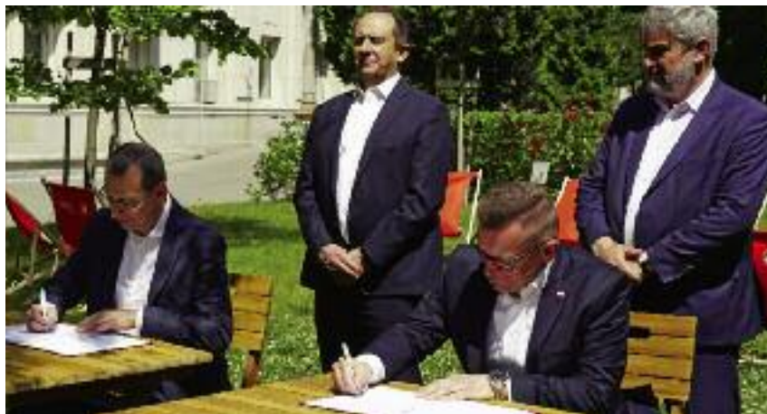
Podpisanie listu intencyjnego dotyczącego współpracy branży turystycznej z lokalnymi producentami żywności

je. Ta stara prawda dziś się potwierdza. Koronawirus zmienił wiele rzeczy, ale życie musi toczyć się dalej. Nadchodzi czas wakacji. Ludzkie obawy są zrozumiałe, a każdy chce odpocząć, tym bardziej po tak długim czasie izolacji i ograniczeń. Prezydent RP Andrzej Duda wyszedł z inicjatywą bonu turystycznego, a my umożliwiłmy rolnikom sprze-