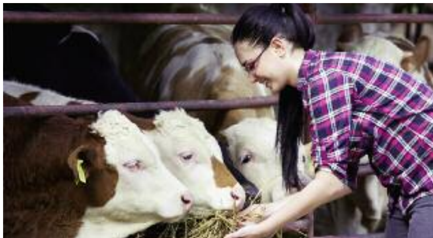
Nauka w szkole rolniczej prowadzonej przez Ministra Rolnictwa i Rozwoju Wsi daje możliwość zdobycia profesjonalnej wiedzy i umiejętności m.in. w zakresie codziennej pielęgnacji zwierząt szkolnych...

Kształcenie w resortowych szkołach rolniczych jest idealnym miejscem dla wszystkich, którzy wiążą swoją przyszłość z rolnictwem, hodowlą zwierząt, weterynarią, mechanizacją rolnictwa i agrotechniki, gastronomią czy też projektowaniem terenów zieleni oraz ogrodów. W szkołach rolniczych kształcenie odbywa się na poziomie: technikum, branżowej szkole I stopnia a od 1 września 2020 r. na poziomie branżowej szkoły II stopnia. Wprowadzenie 2-letniej branżowej szkoły II stopnia, zapewni ciągłość kształcenia zawodowego w szkołach rolniczych. Szkoła ta umożliwi absolwentom branżowej szkoły I stopnia kontynuację kształcenia. II stopień branżowej szkoły będzie funkcjonował w zawodach, które mają kontynuację na poziomie technika. Po ukończeniu szkoły