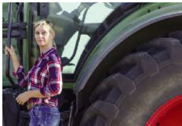
Premia dla młodego rolnika musi w całości zostać przeznaczona na prowadzenie gospodarstwa lub przygotowanie do sprzedaży wytwarzanych w nim produktów rolnych

Dotacja musi w całości zostać przeznaczona na prowadzenie gospodarstwa lub przygotowanie do sprze-