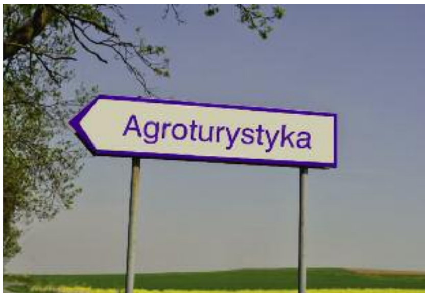
Wsparcie w zakresie rozwoju turystyki wiejskiej jest możliwe w ramach poddziałania „Pomoc na rozpoczęcie pozarolniczej działalności gospodarczej na obszarach wiejskich” PROW 2014-2020

Uwaga! Należy zaznaczyć, że wydłużenie wieku emerytalnego wprowadzone przez rząd PO-PSL było szczególnie dotkliwe dla rolników. Wiek emerytalny dla kobiet został wydłużony o 12 lat, a dla mężczyzn o 7 lat.