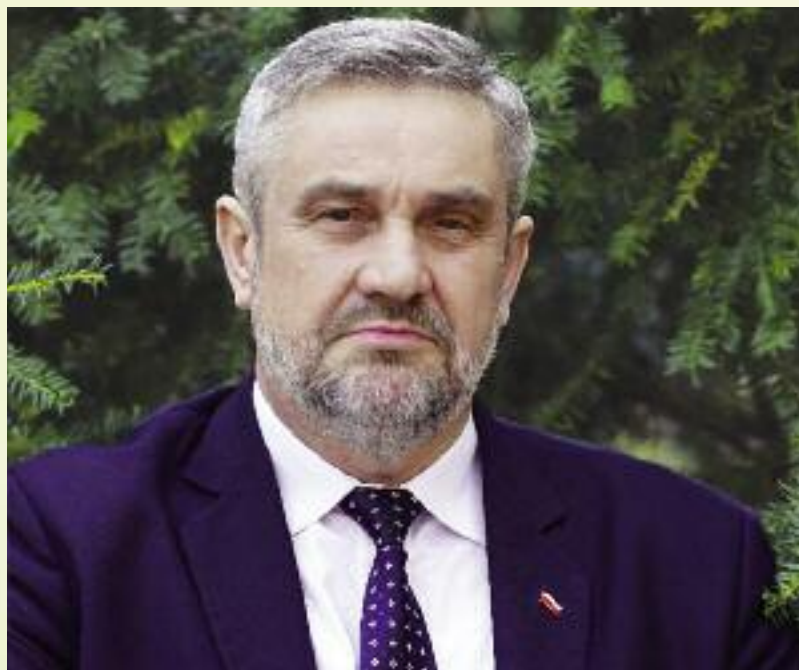
Jan Krzysztof Ardanowski, minister rolnictwa i rozwoju wsi