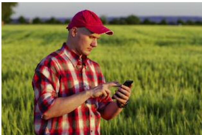
Udostępnienie bezpłatnej aplikacji mobilnej na smartfony dla rolników, jest planowane na wrzesień tego roku

znajdzie szczegółową instrukcję, co za pośrednictwem telefonu ma sfotografować, ile zdjęć zrobić, z jakiego miejsca na polu i w jakim kierunku ma wykonać fotografię,