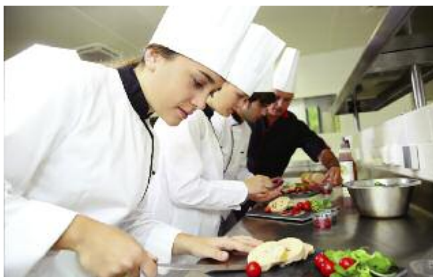
Nauka w szkole resortowej to także m.in. warsztaty kulinarne, kursy baristy, kelnera, koła teatralne, plastyczne i zajęcia rekreacyjno-sportowe

nywania zabiegów leczniczych i codziennej pielęgnacji zwierząt szkolnych), tablice interaktywne umożliwiające planowanie nawożenia, układania dawek pokarmowych dla zwierząt, projektowanie ogrodów, pracownie z najnowszymi urządzeniami do diagnostyki pojazdów;