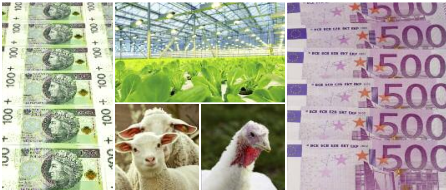
sem COVID-19" będzie jednorazowym, nadzwyczajnym mechanizmem. Planuje się, że wsparciem zostaną objęci rolnicy sektorów: bydła, mleka krowiego, świń, owiec, kóz, drobiu rzeźnego i nieśnego