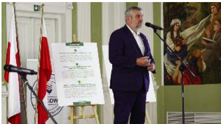
„Nadszedł czas, by Kodeks dotarł do wszystkich osób zajmujących się produkcją żywności, w całym łańcuchu żywnościowym. Troska o konsumenta, o zdrowie nas wszystkich, jest jedną z głównych przesłanek leżących u podstaw powstania Kodeksu” – podkreślał w czasie konferencji minister Jan Krzysztof Ardanowski

Minister Ardanowski za niezbędne uważa przestrzeganie zasad etyki na każdym etapie łańcucha żywnościowego. – Zasiałem ziarno niepokoju u wszystkich, bo wszystkie relacje, powiązania są bardzo ważne. Nie ma usprawiedliwienia dla oszustwa. Najpierw etyka, uczciwość, bo najważniejszy jest człowiek, a dopiero potem biznes. Chciałbym, aby polska żywność postrzegana była na świecie jako żywność gwarantowana, najwyższej jakości. Stąd tak dużą wagę powinniśmy przywiązywać do przestrzegania przez każdego uczestnika łańcucha żywnościowego wszystkich zasad etyki, które zawarte są w Kodeksie – podkreślił szef resortu.