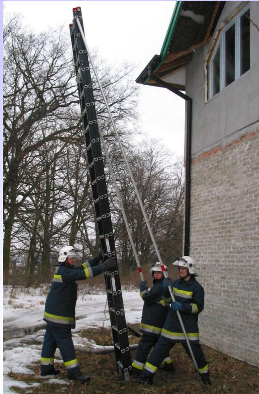
Pozycja przed oparciem drabiny o ścianę