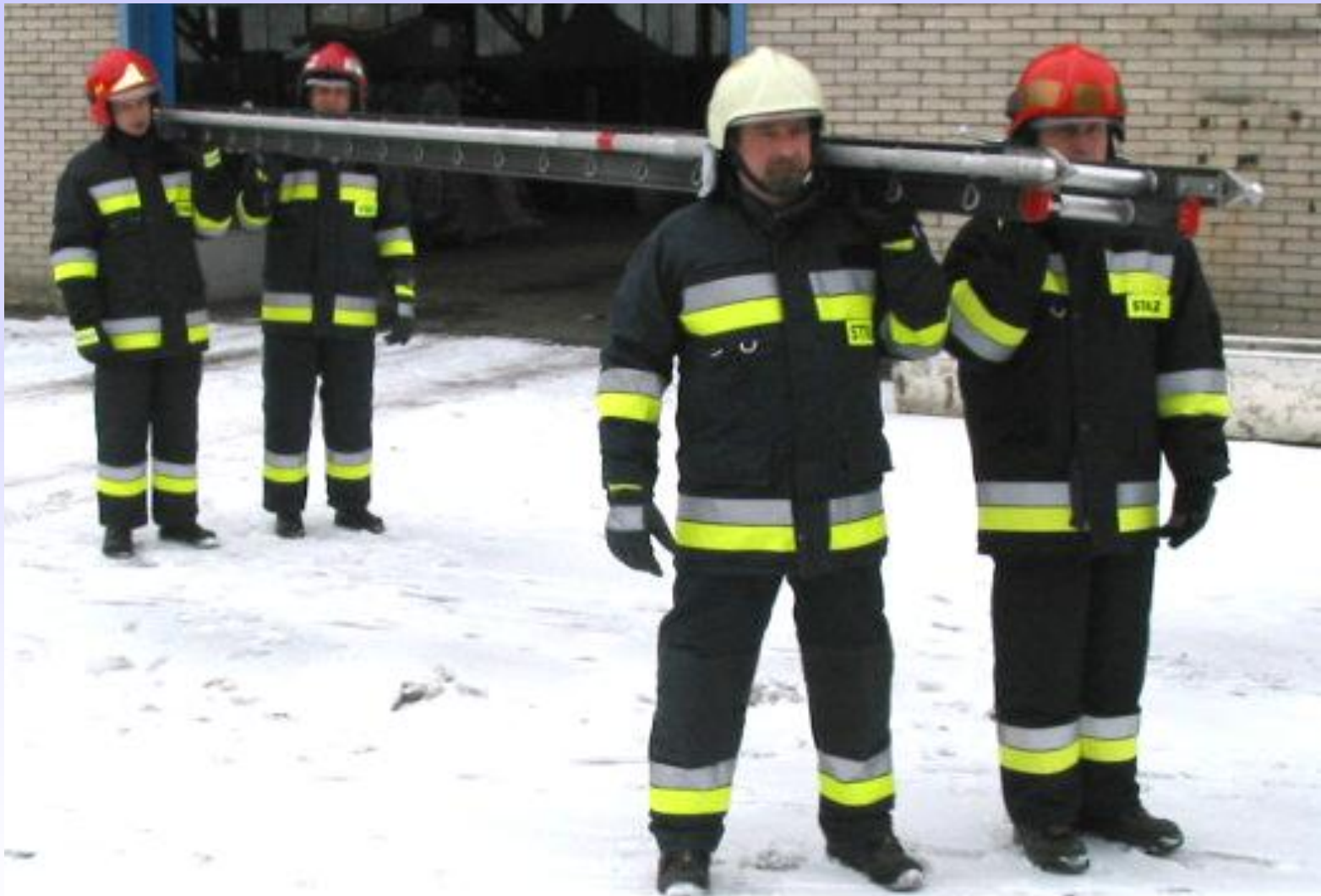
Transport drabiny na miejsce akcji