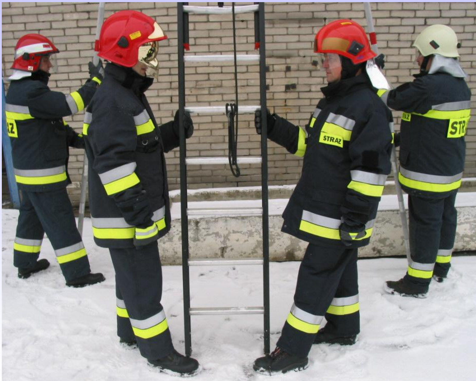
Asekuracja pracujących na drabinie.