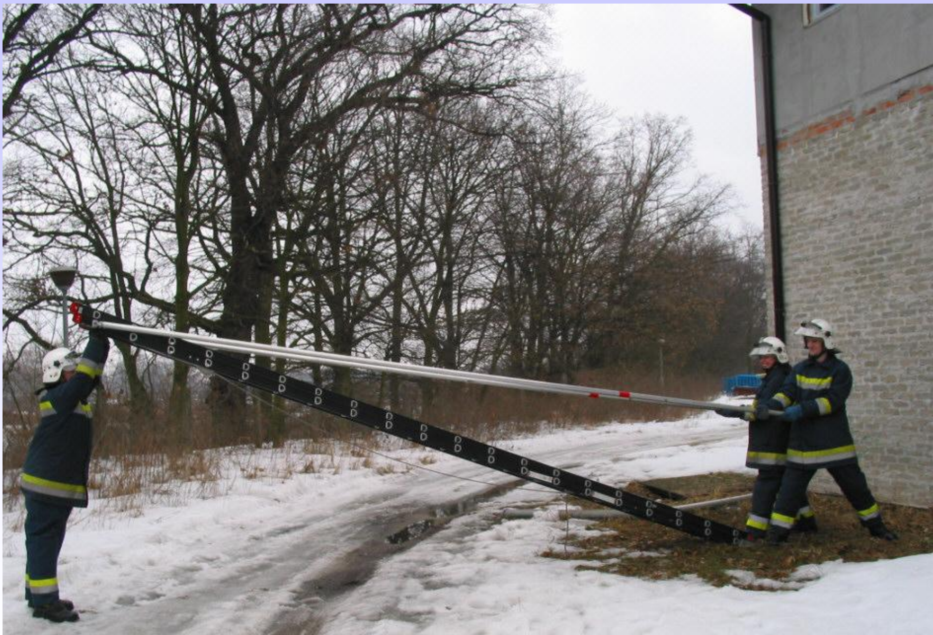
Podnoszenie drabiny do pozycji pionowej.