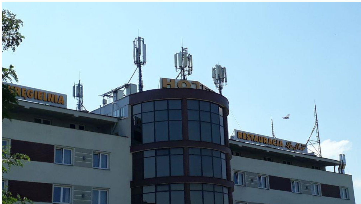
Fot. 1: Widok anten stacji bazowych: ID: KIE1029A, ID: 55317 (27317), ID: BT12100, zlokalizowanych pod adresem: ul. Sikorskiego 2, 25-001 Kielce.