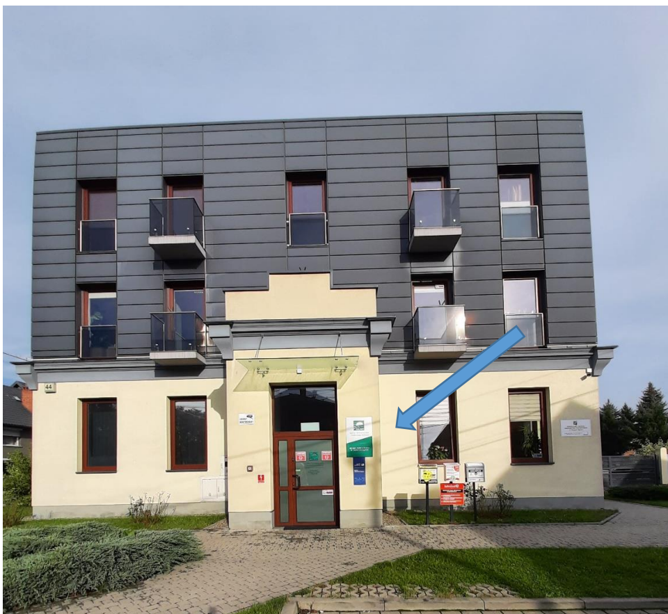
Budynek BP ARiMR w Nowym Sączu- wejście boczne od strony ul. Głowackiego