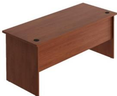
Rys. 1 Przykładowy widok biurka