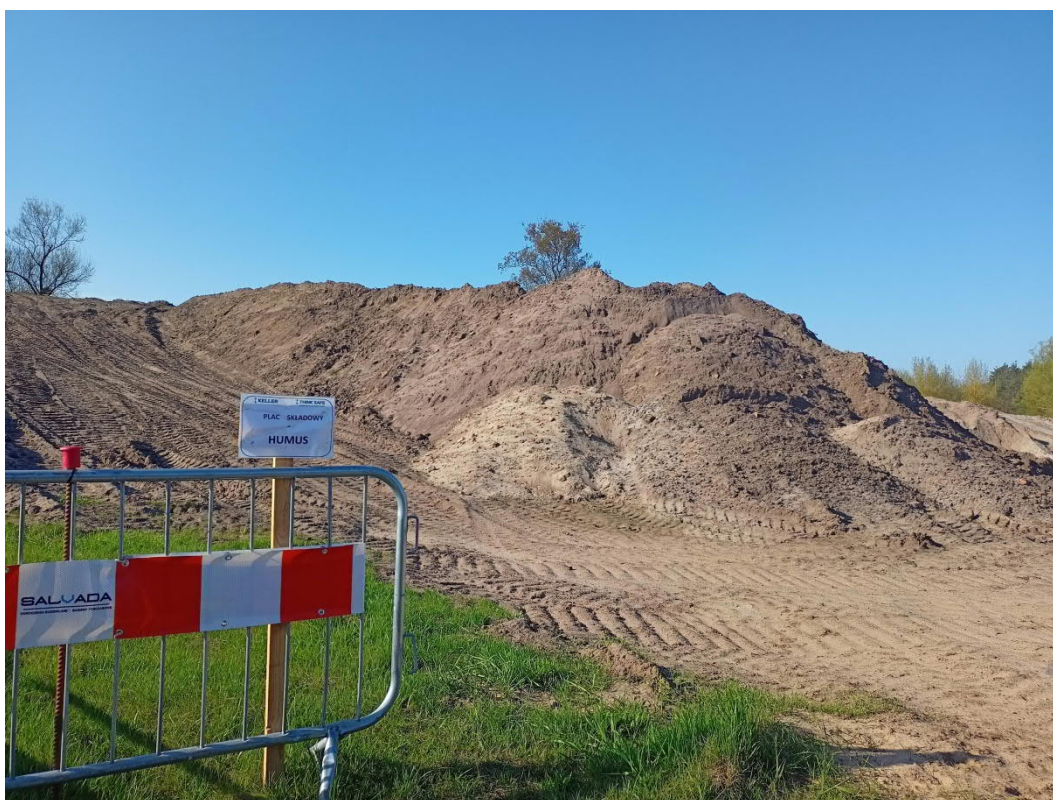
Kwiecień 2022, Piasek, oznakowanie miejsca składowania humusu