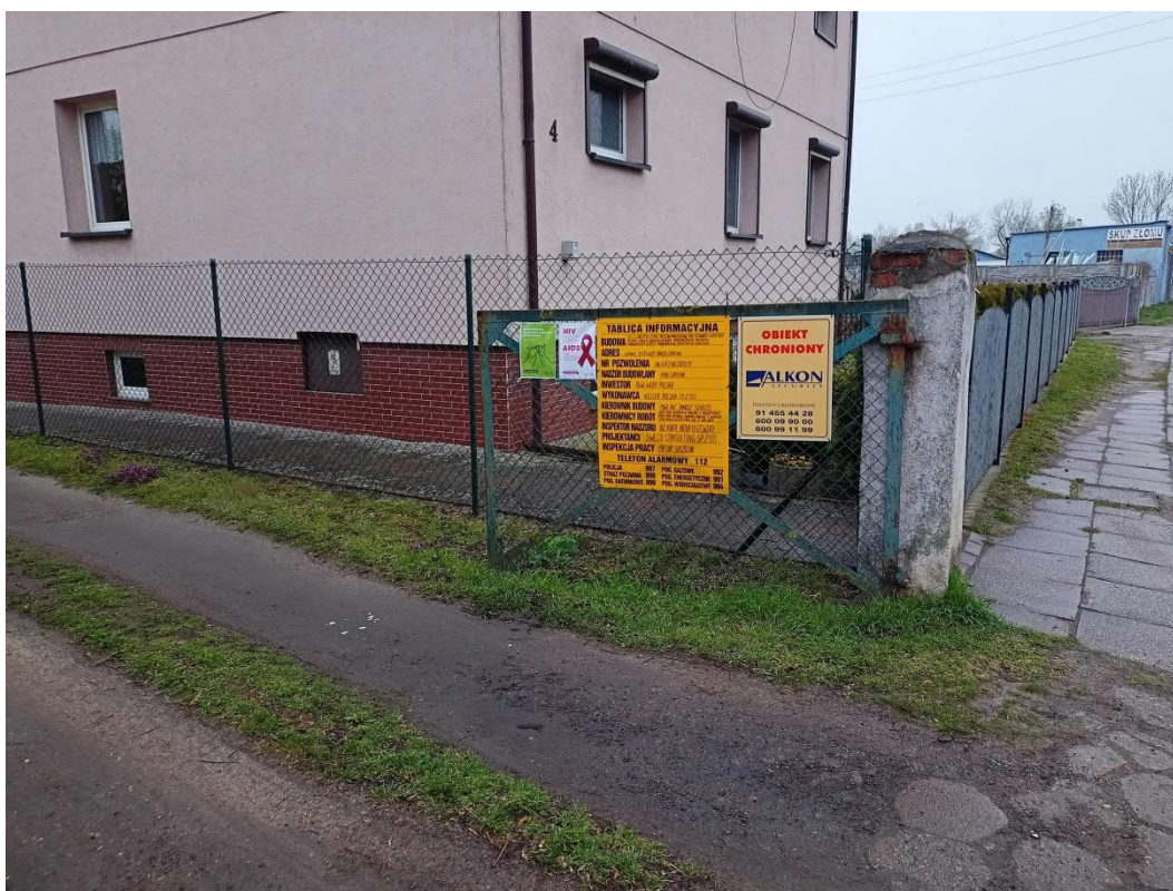
Kwiecień 2022, Gryfino, kampania informacyjna w zakresie chorób zakaźnych