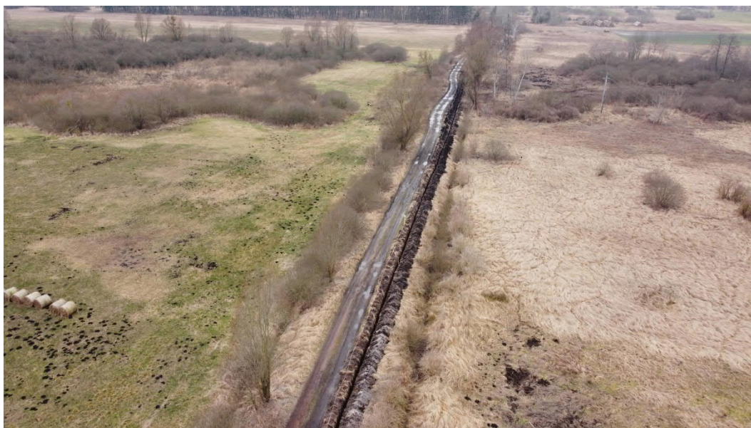
Luty 2022, Krajnik, realizacja robót związanych z układaniem kabla poza okresem aktywności wodniczki