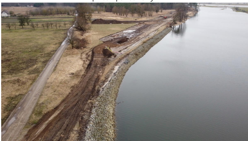
Luty 2022, Piasek, zebranie humusu na terenie przeznaczonym pod wał