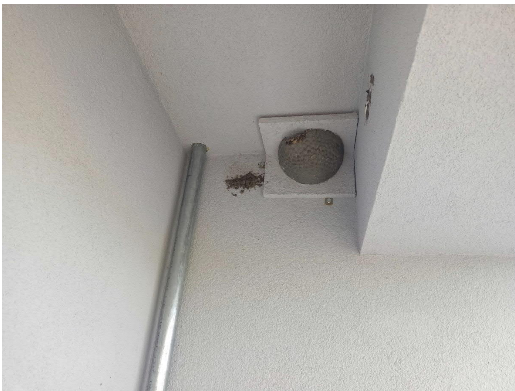
Lipiec 2023, Krajnik, jedno z gniazd zainstalowanych dla jaskółek oknówek