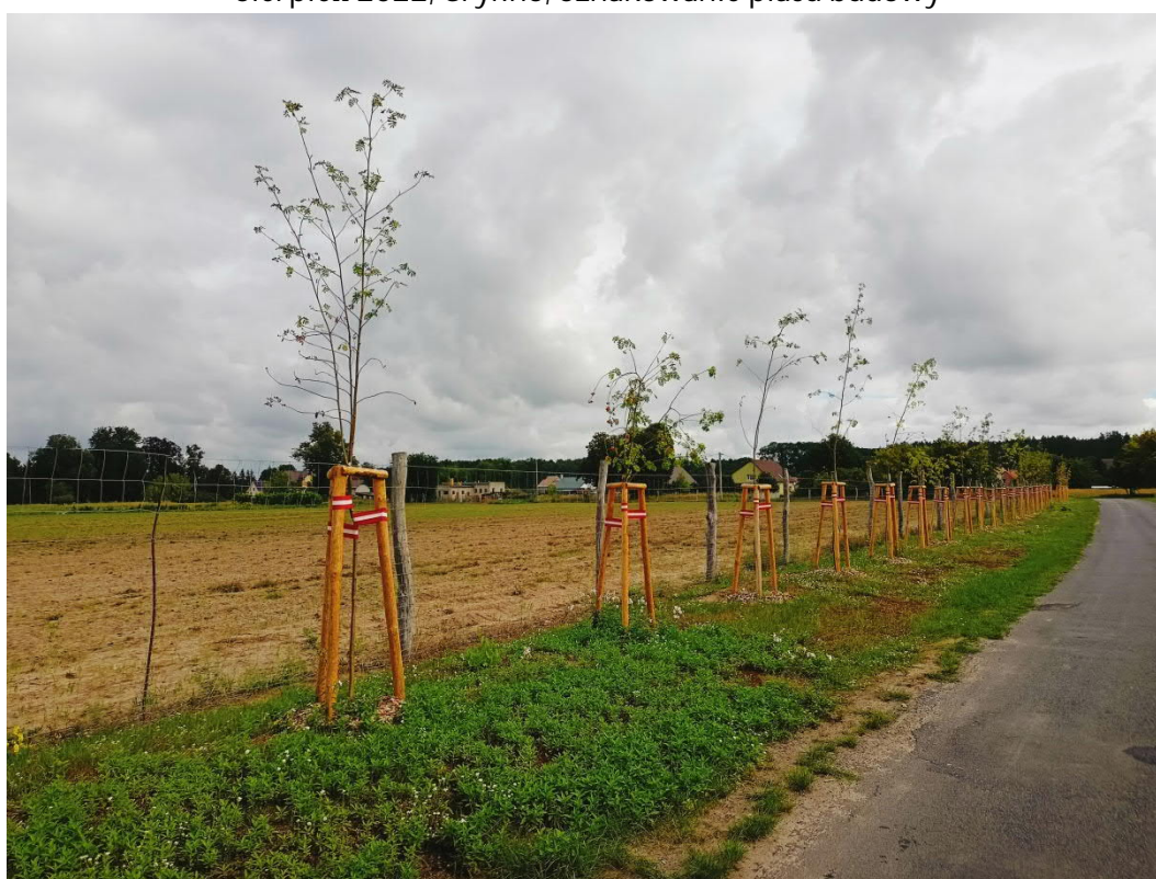
Sierpień 2022, Piasek, nasadzenia zastępcze uzgodnione z gminą Cedynia