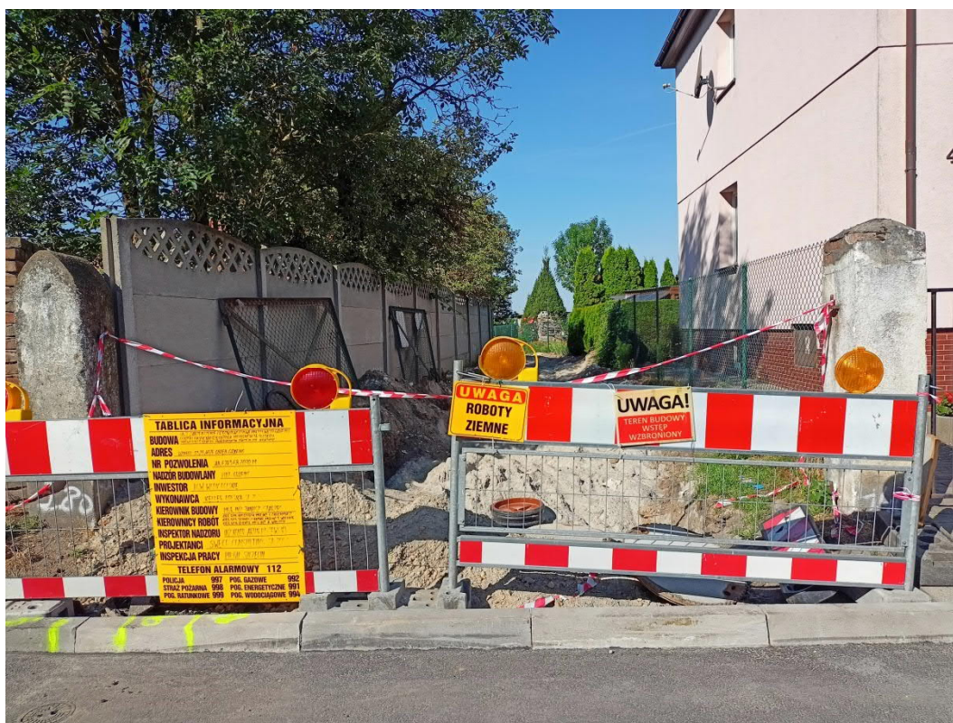
Sierpień 2022, Gryfino, oznakowanie placu budowy