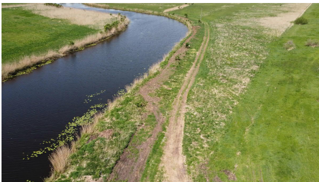
Maj 2022, Krajnik, zakończenie robót związanych z układaniem kabla poza okresem aktywności wodniczki