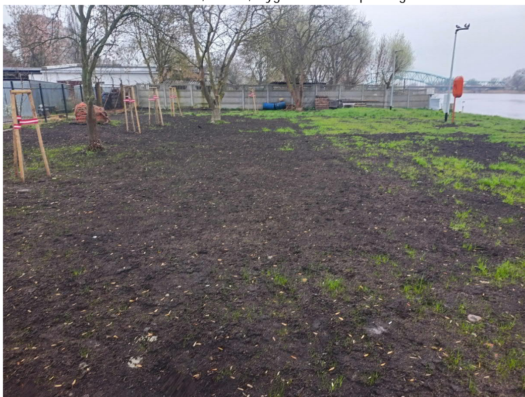
Kwiecień 2023, Gryfino, rekultywacja miejsca zajęcia czasowego oraz nasadzenia zastępcze