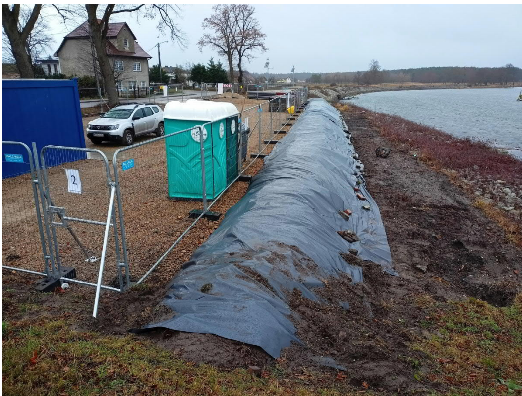
Listopad 2021, Piasek, przygotowanie zaplecza budowy wraz z zabezpieczeniem przeciwpowodziowym