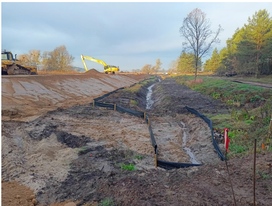
Październik 2022, Piasek, wygradzenie herpetologiczne