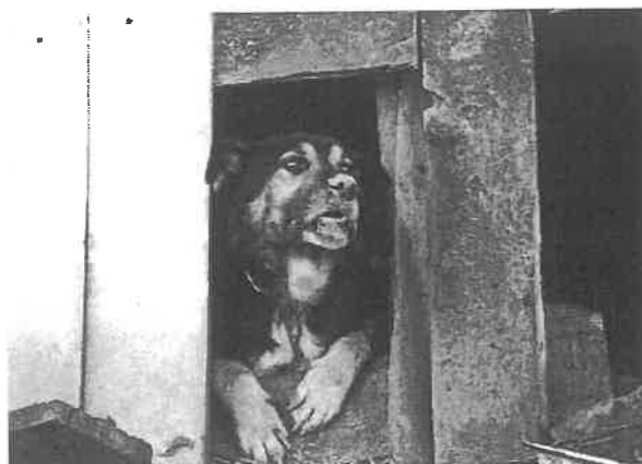
Zdiagnozowany w 2012 r. w pow. rzeszowskim przypadek wścieklizny u psa (postać szalowa)

Wyróżnia się 2 postaci choroby: agresywną (szałową) i cichą (porażenną).