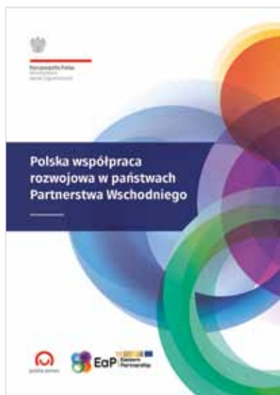
Polska współpraca rozwojowa w państwach Partnerstwa Wschodniego

angażuje się w starania wspólnoty międzynarodowej. Departament rekomenduje, w ramach Polskiej pomocy, podejmowanie działań stabilizujących i wspierających we wskazanych krajach, w tym w naszym bezpośrednim sąsiedztwie. Wszystkie prowadzone działania opierają się na badaniu pod kątem ich skuteczności i celowości m. in. poprzez ewaluację projektów i programów polskiej współpracy rozwojowej prowadzonych przez Departament. Ponadto, DWR pełni funkcję Krajowego Punktu Kontaktowego ds. Krajowego Punktu kontaktowego do spraw współpracy bliźniaczej i instrumentu TAIEX w ramach programów finansowanych z funduszy Transition Facility, IPA i ENPI oraz do spraw Comprehensive Institution Building Programes (CIB) w ramach Partnerstwa Wschodniego. Obsługuje też działania Krajowego Koordynatora Współpracy Rozwojowej oraz Radę Programową Współpracy Rozwojowej.