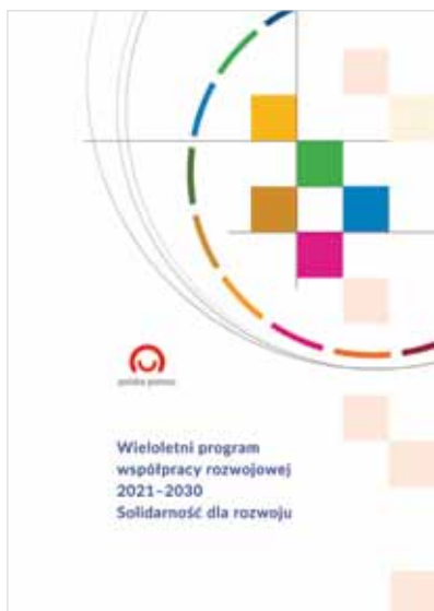
„Solidarność dla rozwoju” Wieloletni Program Współpracy Rozwojowej