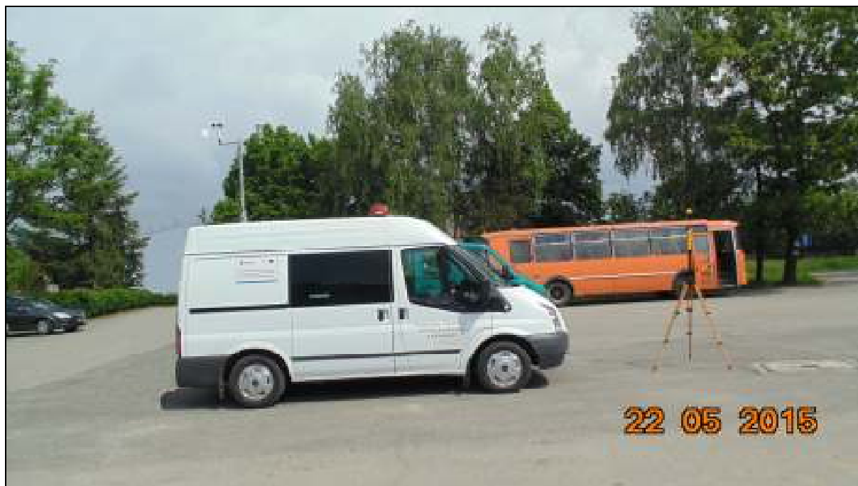
Fot.3. Rejon badań, widok w kierunku północnym