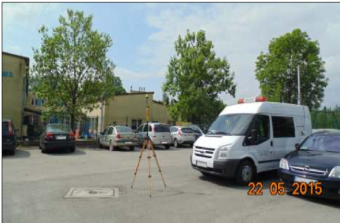
Fot.1. Rejon badań, widok w kierunku zabudowań szkolnych