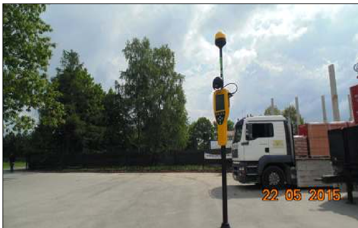
Fot.2. Rejon badań, widok w kierunku wschodnim