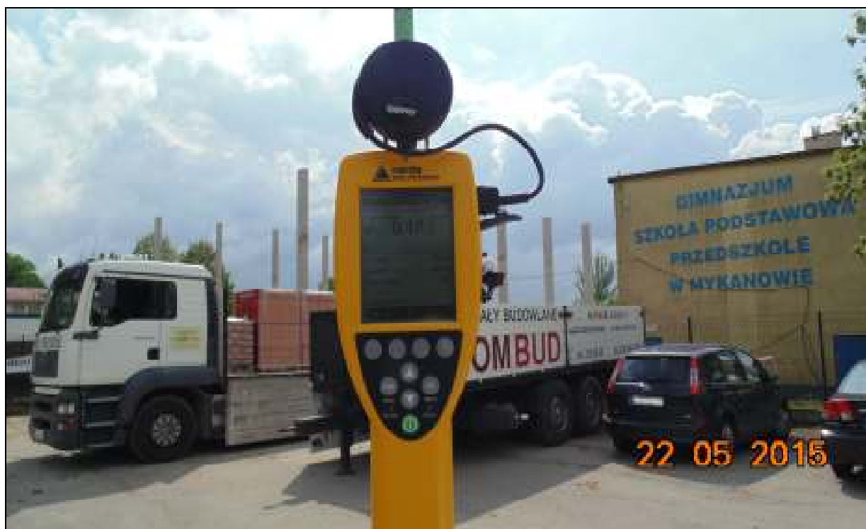
Fot.4. Przyrząd pomiarowy w trakcie wykonywanego badania