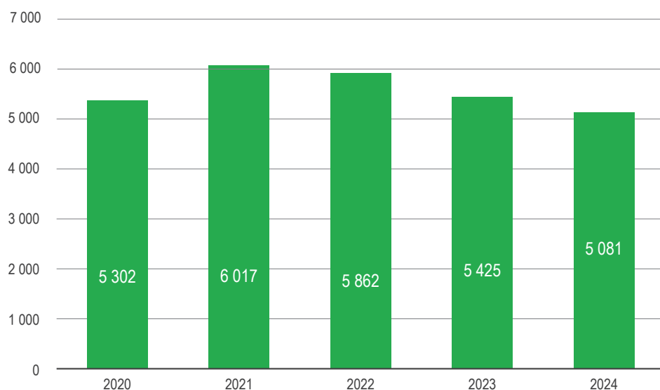
Wypadki zgłoszone w I półroczu w latach 2020–2024

W I półroczu 2024 roku do Placówek Terenowych i Oddziałów Regionalnych KRUS zgłoszono 5 081 zdarzeń wypadkowych, o 344 (6,3%) mniej niż w I półroczu roku poprzedniego.