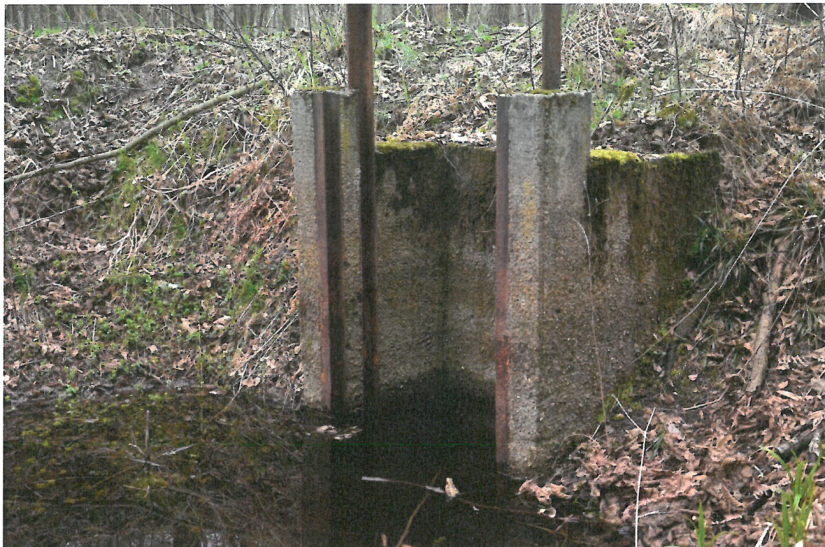
Fotografia 2. Zdjęcie mnicha w obszarze Natura 2000 Diabelski Staw koło Radomicka PLH 080056