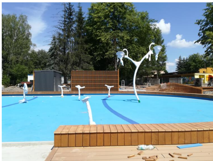
„Wodny Plac Zabaw” w Pabianicach

Z dniem 30.09.2019 r. Wodny Plac Zabaw został zamknięty. Ponowne otwarcie nastąpi w sezonie letnim w 2020 r.