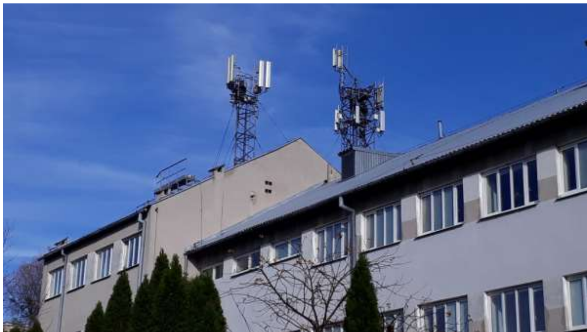
Fot. 1: Widoki anten stacji bazowych ID: BT44457 oraz ID: 0823, zlokalizowanych: ul. Jaroszyka 21, 10-687 Olsztyn