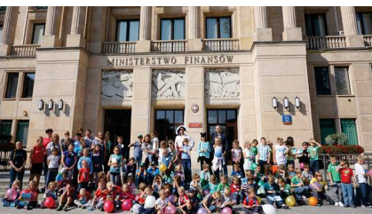
Grupa dzieci przed głównym wejściem ministerstwa

Rok 2017 – pracownicy w ramach wolontariatu zmieniają ministerstwo w rodzinny plac zabaw