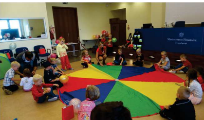
Dzieci w ministerstwie