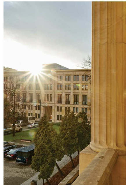
Zachód słońca nad budynkiem