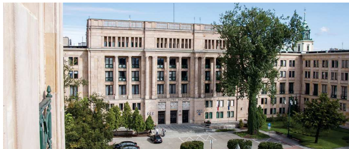
Stuletnia topola przed wejściem głównym

Z piaskowcem ozdabiającym modernistyczne linie gmachu doskonale harmonizują drzewa i krzewy rosnące w ogrodzie wewnętrznym, zabytkowa topola rosnąca przed wejściem głównym.