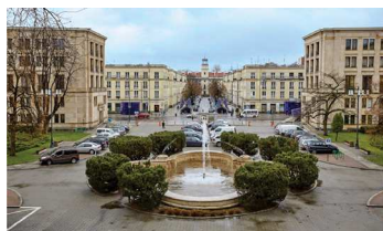
Dziedziniec, widok znad głównego wejścia

Z piaskowcem ozdabiającym modernistyczne linie gmachu doskonale harmonizują drzewa i krzewy rosnące w ogrodzie wewnętrznym, zabytkowa topola rosnąca przed wejściem głównym.