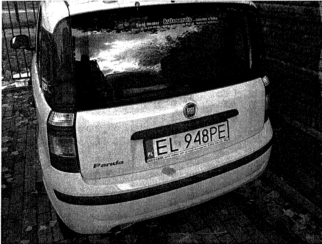
FIAT Panda, nr rejestracyjny EL 948PE