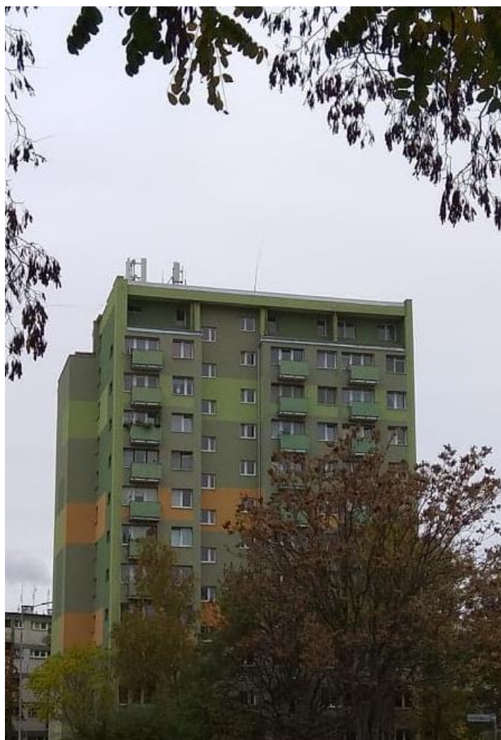
Fot. 1: Widok anten stacji bazowej ID: WRO1174, zlokalizowanej pod adresem: ul. Żelazna 76, 53-429 Wrocław