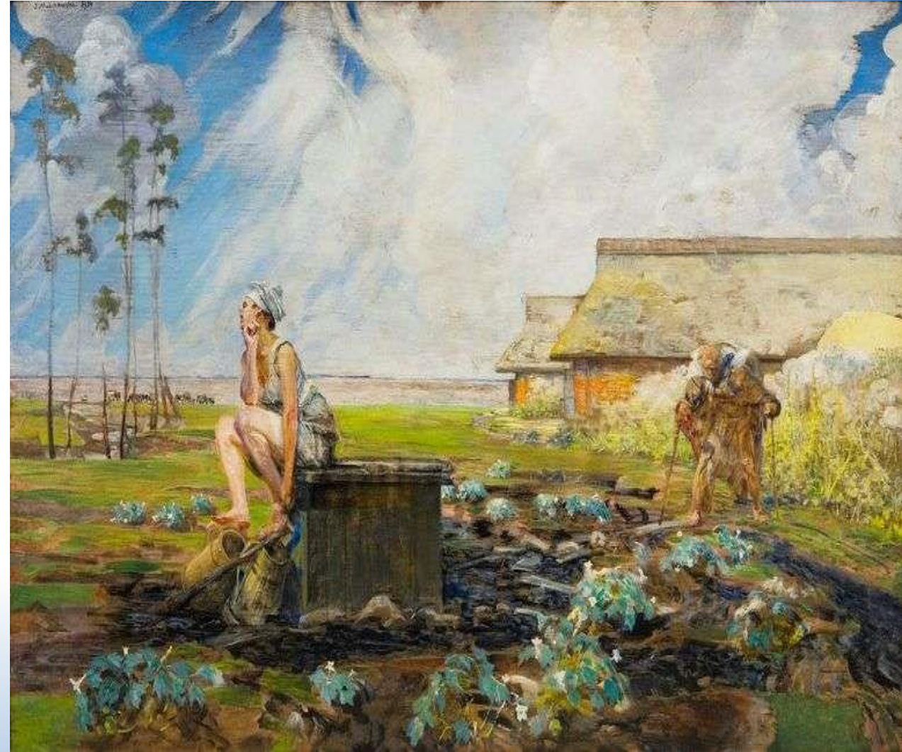
„Zatruta studnia” J. Malczewski